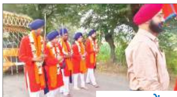
शोभा यात्रा में शामिल पंज प्यारे

सिखों के दसवें गुरु गोबिंद सिंह जी के प्रकाशोत्सव को लेकर रविवार शाम चक्रधरपुर में शोभायात्रा निकाली गई। बड़ी संख्या में सिख समुदाय के बड़ी संख्या में महिला पुरुष शामिल हुए। विभिन्न जगहों पर श्रद्धालुओं ने पुष्प वर्षा कर स्वागत किया। पंच प्यारे की अगुआई में गुरुद्वारा से भजनो के बीच यह शोभायात्रा निकाली गई। शहर के सरस्वती शिशु विद्या मंदिर के छात्र-छात्राएं व स्काउट एंड गाइड्स भी शामिल हुए। शोभायात्रा में सिख समुदाय के लोगों ने नगर कीर्तन कर सुख-शांति समृद्धि की कामना की। संगत व कीर्तन जत्थों ने सतनाम वाहेगुरु, अंग संग रहना जी असी तकिया आसरा तेय, ऊच्चा दर सतगुरु मेरे दा, जय जयकार करे सब कोई, वाहो वाहो गोविंद सिंह आदि शब्दों का