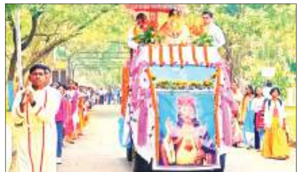
शोभा यात्रा में शामिल मसीही समाज के लोग

ख्रीस्त राजा का पर्व रविवार को चक्रधरपुर में मनाया गया। इस अवसर पर शहर में शोभा यात्रा सह झांकी निकाली गई। जिसमें बड़ी संख्या में मसीही समाज के महिला पुरुष शामिल हुए। इस दौरान शहर में जगह-जगह तोरण द्वार बनाए गए थे, जहां शोभा यात्रा का स्वागत किया गया। छोटी छोटी बच्चियां प्रभु के स्वागत में फूल बरसेते हुए चल रही थीं। शोभा यात्रा कारमेल विद्यालय से निकल कर मुख्य सड़क, प्रेम निवास, पंचमोड, आर्फिसर्स क्लब, लाल गिरजा होते हुए रोमन कैथोलिक चर्च यानी ख्रीस्त राजा गिरिजाघर पहुंचीं। जहां