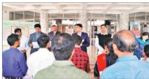
पुलिस पदाधिकारियों व जवानों ने ली संविधान की शपथ

सभी ने भारत को एक संपूर्ण प्रभुत्व- संपन्न समाजवादी पंथ निरपेक्ष लोकतंत्रात्मक गणराज्य बनाने के लिए तथा उसके समस्त नागरिकों को, सामाजिक, आर्थिक और राजनैतिक न्याय, विचार, अभिव्यक्ति, विश्वास, धर्म और उपासना की स्वतंत्रता, प्रतिष्ठा और अवसर की समता प्राप्त कराने के लिए तथा उन सबों में व्यक्ति की गरिमा और राष्ट्र की एकता और अखंडता सुनिश्चित करने वाली बंधुता बढ़ाने का संकल्प लिया। मौके पर जिला परिषद पदाधिकारी, चाईबासा अनुमंडल पदाधिकारी, जिला आपूर्ति पदाधिकारी, जिला कोषागार पदाधिकारी, जिला शिक्षा अधीक्षक, जिला सूचना एवं विज्ञान पदाधिकारी, जिला पशुपालन पदाधिकारी सहित अन्य जिला स्तरीय पदाधिकारी एवं समाहरणालय कर्मी, पुलिस के जवान उपस्थित रहे।