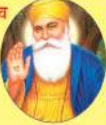
पंत पंत श्री गुरु नानक देव जी के पूजन पुत्रव दौआं भप सड ठुं लंख लंख बधाइयां