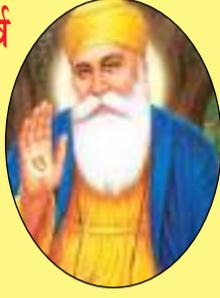
पंत पंत श्री गुरु नानक देव जी के पूजन पुत्रव दौआं भप सड ठुं लंख लंख बधाइयां