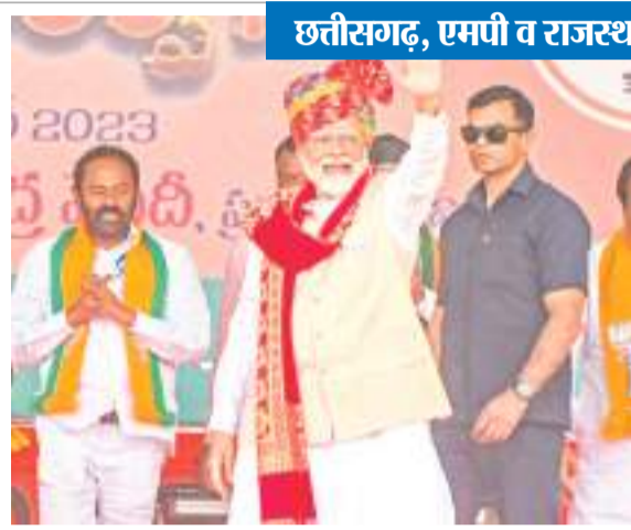
छत्तीसगढ़, एमपी व राजस्थान में विपक्षी गठबंधन का सफाया होगा : प्रधानमंत्री

जैसे-जैसे तेलंगाना में वोटिंग नजदीक आ रही है, वैसे-वैसे राज्य में चुनाव रोचक मोड़ लेता जा रहा है। सत्ता में काबिज भारत राष्ट्र समिति और कांग्रेस को सीधे टक्कर में कई जगह भाजपा लड़ाई को तिकोना बना रही है। कहा जा रहा है कि बीआरएस-कांग्रेस के सीधे मुकाबले में भाजपा का प्रदर्शन चुनावी समीकरणों में उलटफेर कर सकता है। तेलंगाना के लोग समझ रहे हैं कि बीआरएस और भाजपा के बीच दोस्ताना नुराकुशती हो रही है। हालांकि, कई सीटों पर भाजपा राज्य में प्रभावी तौर पर मुकाबले में है। कई ऐसी सीटें हैं, जहां भाजपा का प्रदर्शन बीआरएस-कांग्रेस के मुकाबले में बाजी चलाने की हैसियत रखता है। उनमें हैदराबाद के अलावा, निर्मल, आदिलाबाद, करीमनगर, हुजूरबाद और निजामाबाद जैसे