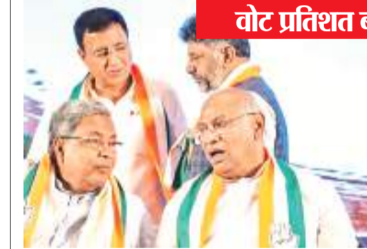
वोट प्रतिशत बढ़ने से उत्साहित है पार्टी

राजस्थान विधानसभा चुनाव के लिए मतदान के बाद प्रत्याशियों का भविष्य ईवीएम में बंद हो गया है। कौन जीतेगा कौन हारेगा, 3 दिसंबर को नतीजे आने के बाद साफ हो जाएगा। मगर भाजपा ने किसी भी तरह की गड़बड़ से बचने के लिए नतीजों के बाद विधायकों की बाड़बंदी करेगी। एक-दो दिन में प्रदेश के वरिष्ठ नेता बैठ कर बाड़बंदी की रूपरेखा तैयार करेंगे। इसके बाद पार्टी प्रत्याशियों को इसकी सूचना भेजी जाएगी। सूत्रों की मानें तो पार्टी को पूर्ण बहुमत मिलने की स्थिति में जयपुर या उसके आसपास किसी होटल या रिसोर्ट में नवनिर्वाचित