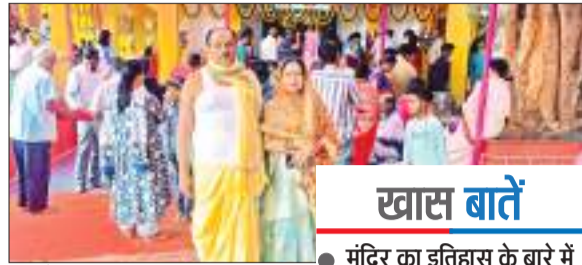
पूजा में शामिल सीजीएम व उनकी पत्नी

महाभोग का आयोजन मंदिर प्रांगण में किया गया, जिसमें झारखंड-ओडिशा के हजारों महिला, पुरुष व बच्चे शामिल हुये।