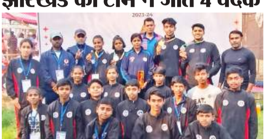
खेल संवाददाता। रांची

बिहार के पटना स्थित पाटलिपुत्र स्पोर्ट्स कॉम्प्लेक्स में आयोजित 11वीं प्री टीन, प्री जूनियर और जूनियर महिला एवं पुरुष राष्ट्रीय पंचक सिलाट प्रतियोगिता का समापन रविवार को हुआ। इस प्रतियोगिता में सभी राज्यों से लगभग 1200 खिलाड़ियों ने भाग लिया। झारखंड की ओर से महिला एवं पुरुष वर्गों में 28 खिलाड़ियों ने भाग लिया, जिसमें 4 खिलाड़ियों ने मेडल