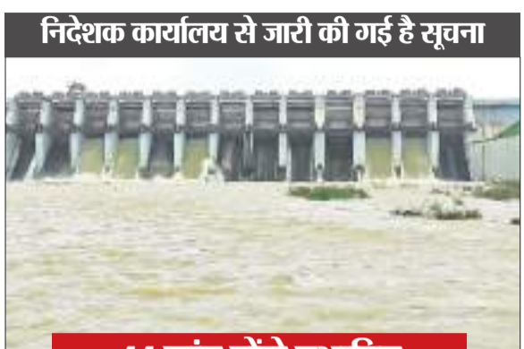
निदेशक कार्यालय से जारी की गई है सूचना

सुवर्णरेखा बहुदेशीय परियोजना चांडिल डैम के आरएल 183 मीटर की जद में आने वाले गांवों के विस्थापितों को अपने दावे, आपत्ति व आवेदन देने के लिए 31 दिसंबर तक की मोहलत दी गई है। सुवर्णरेखा परियोजना के अपर निदेशक के कार्यालय से सूचना जारी की गई है। इसके अनुसार झारखंड सरकार के जल संसाधन विभाग के सचिव द्वारा दिए गए निर्देश के आलोक में चांडिल बांध प्रकल्प में आरएल 183 मीटर तक जल भंडारण करना है। इसको लेकर विभाग ने काम शुरू कर दिया है। इससे प्रभावित विस्थापितों को अगर किसी प्रकार का दावा, आपत्ति या आवेदन देना हो तो इसके लिए सूचना दी जा रही है। सभी प्रकार के आवेदनों के निष्पादन के बाद डैम में 183 मीटर तक जल भंडारण किया जाना है।