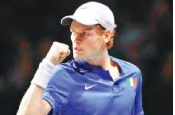
दिया जिससे इटली शुरू में पिछड़ने के बावजूद 2-1 से जीत दर्ज करके 1998 के बाद पहली बार डेविस कप फाइनल में जगाह बनाने में

नोवाक जोकोविच के पास सर्बिया को डेविस कप टेनिस टूर्नामेंट के फाइनल में पहुंचाने के तीन मौके थे, लेकिन वह यानिक सिनर थे, जिन्होंने हार के कगार पर पहुंचने के बाद शानदार वापसी करके इटली को खिताबी मुकामले में पहुंचाया। सिनर ने लगातारी तीन मैच प्वाइंट बचाकर जोकोविच का डेविस कप के एकल में लगातार 21 मैच जीतने के अभियान पर रोक लगाई। सिनर की जीत से इटली मुकामले को 1-1 से बराबर करने में सफल रहा। सिनर ने इस्क्रे बाद विश्व के नंबर एक खिलाड़ी जोकोविच को युगल में भी झटका