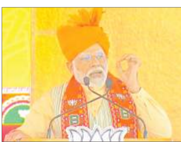
प्रधानमंत्री नरेंद्र मोदी ने राजस्थान में सत्तारूढ़ कांग्रेस पर निशाना साधते हुए शनिवार को कहा कि जहां-जहां कांग्रेस आती है वहां आतंकवादी, अपराधी और दंगाई बेलगाम हो जाते हैं और कांग्रेस के लिए तुष्टिकरण ही सबकुछ है।

मोदी ने कहा, एक तरफ तो भारत दुनिया में अग्रणी बन रहा है, दूसरी तरफ राजस्थान में बीते पांच वर्ष में क्या हुआ? पांच साल में जो बर्बादी हुई उसके लिए जिम्मेदार कौन है? यहां कांग्रेस ने राजस्थान को भ्रष्टाचार, दंगों और अपराधों में अग्रणी बना दिया। इसलिए राजस्थान कह रहा है- जादूगर की कौनी मिले वोट जो (वोट नहीं मिलेंगे)। उन्होंने कहा, बीते पांच साल में बहनों-बेटियों, दलितों, वंचितों पर सबसे ज्यादा अपराध हुआ, सबसे ज्यादा अपराध हुआ, रामनवमी हो, हनुमान जयंती हो, कोई भी त्योहार आप लोग शांति से नहीं मना पाए।