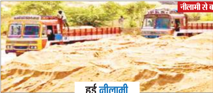
नीलामी से बालू संकट से मिलेगी निजात