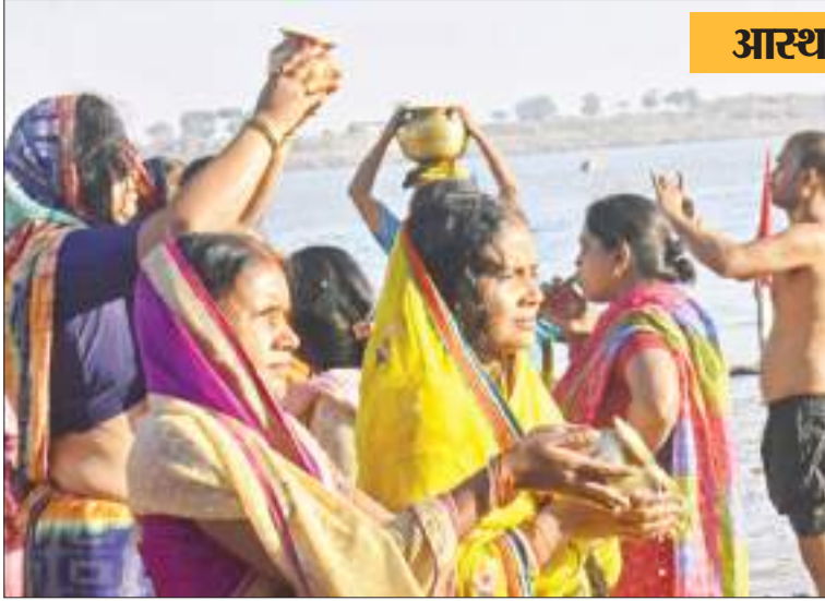
खरना का प्रसाद बनाने से पहले पटना के गंगा नदी घाट पर स्नान करती छठव्रती.