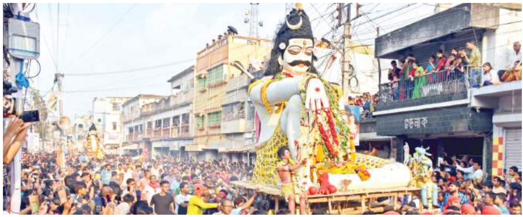
मुर्शिदाबाद: शनिवार को मुर्शिदाबाद जिले के बेलडांगा में कार्तिक लोहरी के जुलूस के दौरान देवी-देवताओं की मूर्तियों को विसर्जन के लिए ले जाते श्रद्धालु।