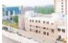
पब्लिक श्रेणी में दो प्लॉट के लिए रिजर्व प्राइस 4.55 करोड़ रुपए रखी गई है।

चौथे चरण के ई-ऑक्शन में 14 व्यावसायिक प्लॉट नीलामी के लिए रखे गए हैं। इनकी दर 13.24 करोड़ रुपए प्रति एकड़ रखी गई है। मिक्स यूज के लिए 12 प्लॉट रखे गए हैं। इनकी रिजर्व प्राइस 10.14 करोड़ रुपए रखी गई है। शैक्षणिक और संस्थागत क्षेत्र के आठ प्लॉट हैं, जिनकी रिजर्व प्राइस प्रति एकड़ 2.07 करोड़ रुपए है। पब्लिक और सेमी