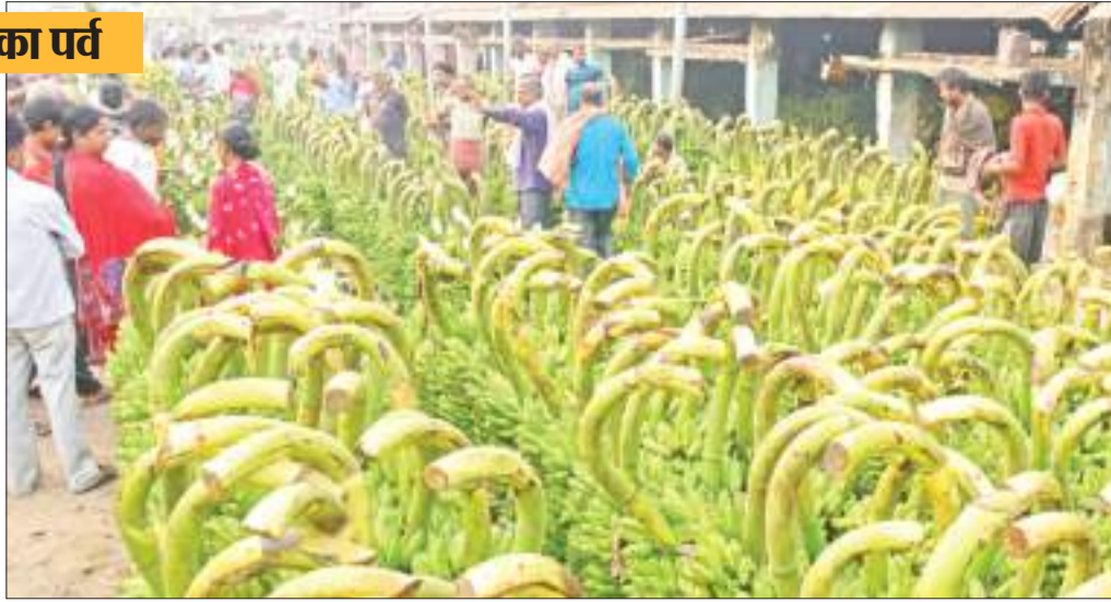
छठ पूजा के लिए पटना के मार्केट में सजी केले की दुकानें.