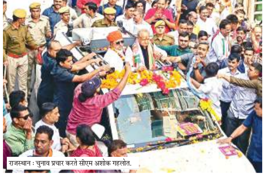
राजस्थान : चुनाव प्रचार करते सीएम अशोक गहलोत.