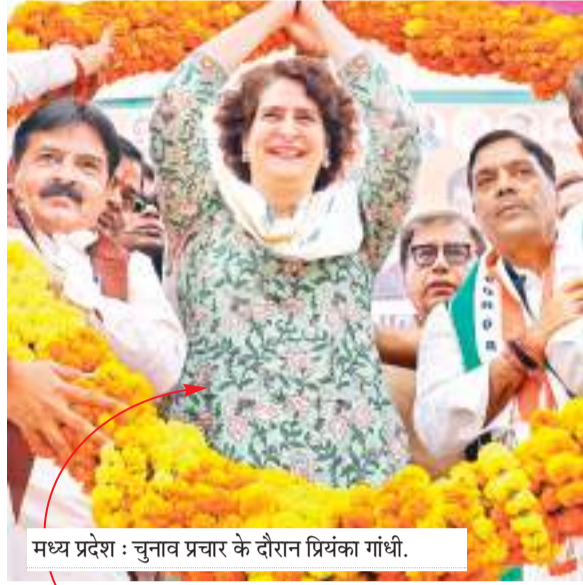
मध्य प्रदेश : चुनाव प्रचार के दौरान प्रियंका गांधी.