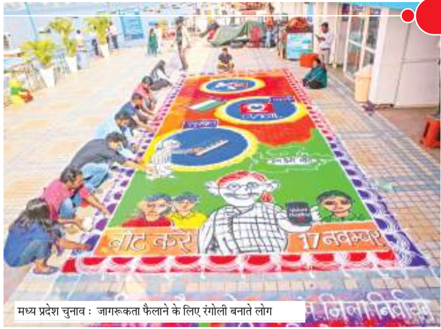
मध्य प्रदेश चुनाव : जागरूकता फैलाने के लिए रंगोली बनाते लोग