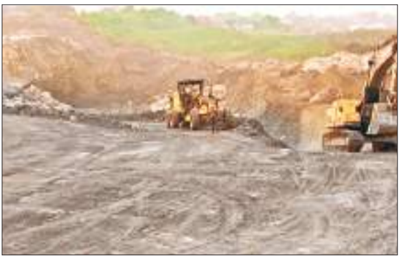
तेतुलमारी परियोजना में ओबी हटाया डोजर।

बीसीसीएल एरिया पांच के तेतुलमारी परियोजना में संचालित निजी कंपनी चेन्नई राधा इंजीनियरिंग प्राइवेट लिमिटेड 40 लाख टन कोयला का उत्पादन करेगी। दो लाख दस हजार ओबी हटाने का लक्ष्य निर्धारित किया गया है। कंपनी को पांच साल की लिए कार्य करने की अनुमति मिली है। यहां कंपनी के संचालित होने से स्थानीय लोगों को रोजगार का अवसर मिलेगा। निजी कंपनी में लगभग 200 स्थानीय लोग काम करेंगे।