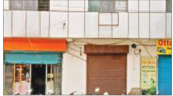
साकची में बंद सहारा का शाखा कार्यालय।