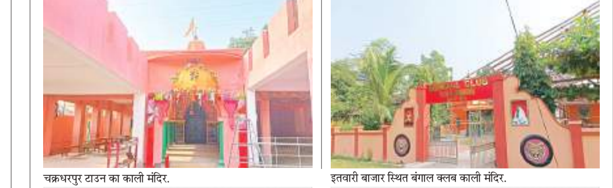
चक्रधरपुर टाउन का काली मंदिर.

चक्रधरपुर में प्रत्येक वर्ष श्रद्धा बाघ के साथ माता काली पूजा की जाती है. इस वर्ष भी पूजा की तैयारी की गई है. चक्रधरपुर के विभिन्न स्थानों पर माता काली मंदिर के अलावे कई जगहों पर पंडाल का निर्माण कर पूजा अर्चना की जाती है. अमावस्या पर होने वाली काली पूजा में देर रात श्रद्धालु मंदिर व पूजा पंडाल में पूजा अर्चना के लिए जुटे रहते हैं. चक्रधरपुर के इतवारी बाजार के समीप स्थित बंगाल काली पूजा समिति इस वर्ष स्वर्ण जयंती समारोह मना रहे हैं.यहां वर्ष 1963 से मंदिर में माता काली की पूजा अर्चना की जाती रही है. इस वर्ष स्वर्ण जयंती समारोह पर भक्ति कार्यक्रम के साथ-साथ अन्य कार्यक्रम आयोजित किए जा रहे हैं. जहां विभिन्न जगहों से पहुंचकर गायक, कलाकार पहुंचकर अपनी प्रस्तुती देंगे. स्वर्ण जयंती समारोह को लेकर आकर्षक साज सज्जा की गई है.यहां चक्रधरपुर के श्मशान काली मंदिर, टाउन काली मंदिर, पॉटर्जखोली काली मंदिर, रिपनजुं कालीनी स्थित काली मंदिर, आरूं कालीनी काली मंदिर, टोकलौ रोड स्थित काली मंदिर, रितायर्ड कालीनी काली मंदिर समेत अन्य कई मंदिरों में पूजा अर्चना की जाएगी.यहां चक्रधरपुर के रेवेले स्टेशन, इतवारी बाजार, लौकी कालीनी, बीएसएनएस कार्यालय के समीप सहित अन्य प्रतिष्ठान स्थापित कर माता काली की पूजा अर्चना होगी. इसे लेकर समिति के सदस्य द्वारा पंडाल का निर्माण किया गया है.