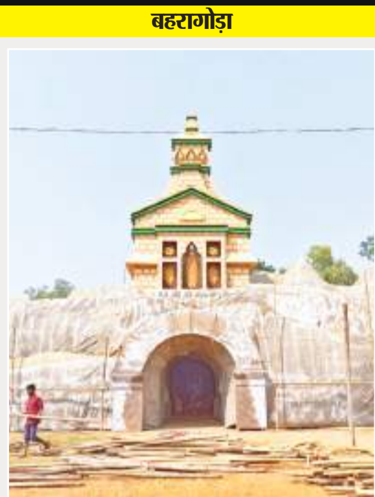
बहरागोड़ा काली संघ क्लब, पाटपुर सार्वजनिक काली पूजा कमेटी