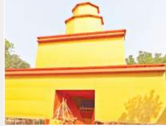
मां तारा संघ, बहरागोड़ा श्मशान काली पूजा कमेटी का पंडाल