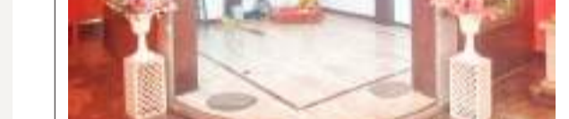
श्री श्री 108 अखंड ज्योति काली मंदिर