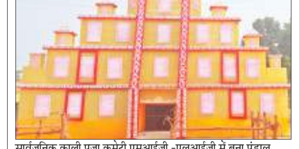
सार्वजनिक काली पूजा कमेटी एमआईजी - एलआईजी में बना पंडाल.