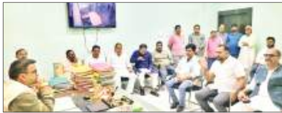
उप नगर आयुक्त से चर्चा करते जिला अध्यक्ष सहित अन्य.