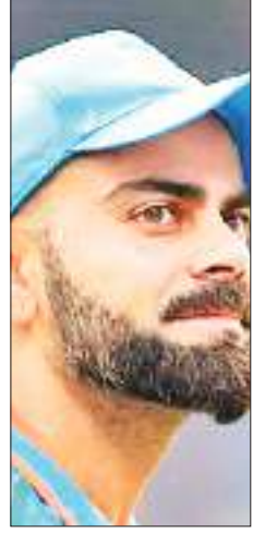
विराट कोहली, भारत