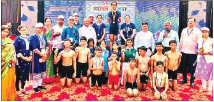
स्वर्णरेखा क्षेत्र विकास ट्रस्ट के तत्वावधान में आयोजित पांच दिवसीय बाल मेला में शामिल बच्चे।