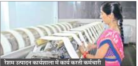
रेशम उत्पादन कार्यशाला में कार्य करती कर्मचारी