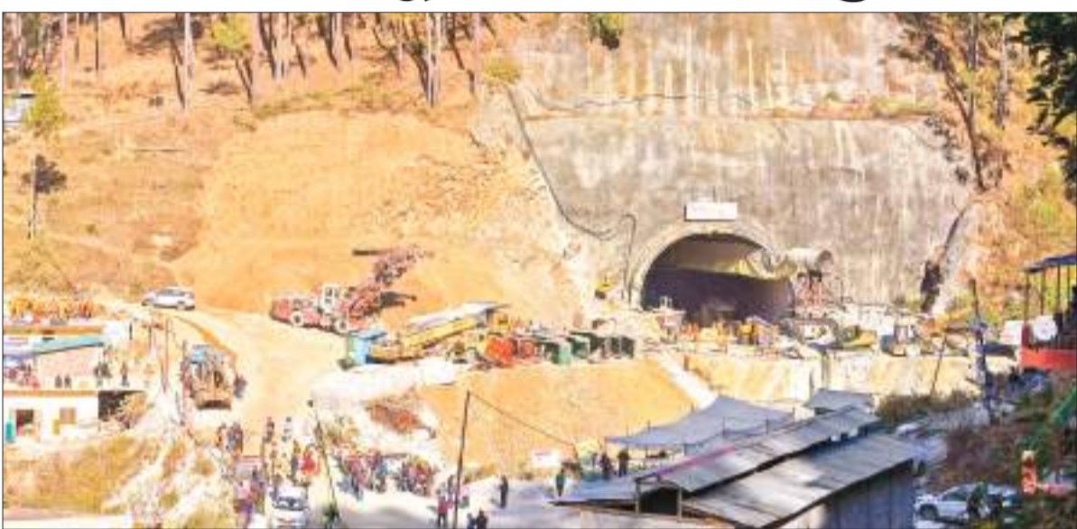
श्रमिकों के लिए रास्ता तैयार करने के लिए ड्रिलिंग के दौरान सुरक्षाकर्मी और अन्य लोग.