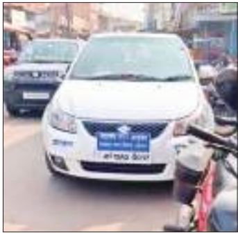
जानकारी के अनुसार, सहायक नगर आयुक्त कतरासगढ़ राजेंद्र क्लब में आयोजित सरकार

राज्य में अधिकारियों की अफसरशाही व उनकी मनमानी कोई नई बात नहीं है। अधिकारियों की मनमानी व तानाशाही से अक्सर आम लोगों को परेशानी उठानी पड़ती है। इसकी बानगी शुक्रवार को कतरास बाजार में दिखी। धनबाद नगर निगम के सहायक नगर आयुक्त के वाहन ने आम राहगीर को घंटों परेशान कर रखा। हुआ यूँ कि सहायक नगर आयुक्त का वाहन घंटों कतरासगढ़ के व्यस्ततम सड़क पर खड़ी रहा, जिसकी वजह से शहर में जाम लगा रहा। सड़कों पर गाड़ियों रेंगती रहीं। राहगीर घंटों जाम में फंसे रहे।