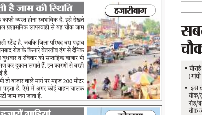
बरही चौक पर हर वकत बनी रहती है जाम की स्थिति

चाँदिल अनुमंडल क्षेत्र या कई या ईशगढ़ विधानसभा क्षेत्र. यहां कड़ी भी ट्रैफिक सिग्नल नहीं लगाया गया है. राष्ट्रीय राजमार्ग 82 और 83 के संगम स्थल पर भी सिग्नल नहीं लगा है. जिसका नतीजा है कि अनुमंडल क्षेत्र के चौक-चौराहों में आने-जाने का स्थिति बनी रहती है. चाँदिल गोलचालर सबसे व्यस्त चौक में से एक है. चाँदिल हट वहां बड़ी संख्या में छोटे-बड़े व्यवसायिक वाहन गुजरते हैं. ट्रैफिक पुलिस के अनुसार 24 घंटे में दो हजार से अधिक वाहन गुजरते हैं. चाँदिल गोलचालर में दिन के वकट ट्रैफिक पुलिस तैनात रहते हैं, जो वाहन वाहनों की नियंत्रणी करते हैं कि वाहक ट्रैफिक नियमों का अनुपालन कर रहे हैं या नहीं. नियमों का अनुपालन नहीं करने वाले वाहन वाहकों से ट्रैफिक पुलिस जुर्माना भी वसूलती है.