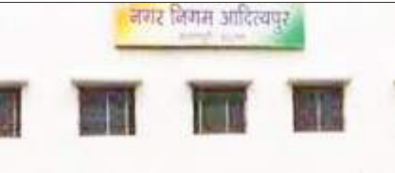
नगर निगम की तस्वीर.