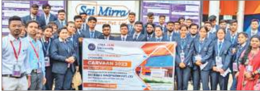
दौरे में शामिल छात्र-छात्राएं व शिक्षक।

गमहरिया स्थित अरका जैन यूनिवर्सिटी की ओर से अपने स्कूल ऑफ फार्मेसी के छात्र-छात्राओं को औद्योगिक यात्रा के तहत चेन्नई स्थित साई मीरा इन्फोर्म प्रोडक्ट लिमिटेड का भ्रमण कराया गया। इस दौरे में यूनिवर्सिटी के स्कूल ऑफ फार्मेसी के 79 छात्र-छात्राएं और 7 संकाय सदस्य शामिल थे। स्कूल ऑफ फार्मेसी के डीन डॉ. ज्योतिर्मय साहू ने इस दौरे को लेकर आवश्यक व्यवस्था की थी। छात्र-छात्राओं की यह यात्रा पिछले नौ नवंबर आरंभ हुई। इस क्रम में छात्र-छात्राओं ने औद्योगिक यात्रा के अलावा