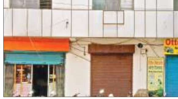
साकची में बंद सहारा का शाखा कार्यालय.