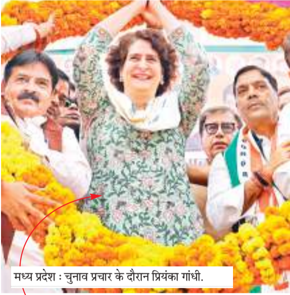
मध्य प्रदेश : चुनाव प्रचार के दौरान प्रियंका गांधी.