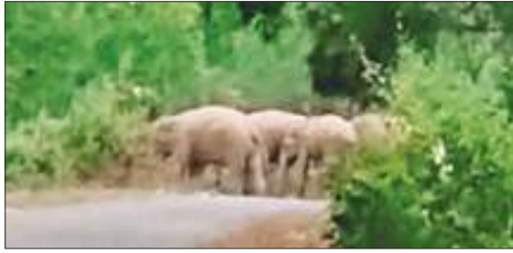
सड़क पार करती हाथियों का झुंड.

चांडिल अनुमंडल क्षेत्र में जंगली हाथियों के उत्पात की खबर इन दिनों सुर्खियों में है। ताजा मामला नीमडीह प्रखंड क्षेत्र का है। पिछले कई दिनों से जंगली हाथियों का उत्पात नीमडीह प्रखंड क्षेत्र के गुंडा, काशीपुर, कुशपुतल, होदागोड़ा समेत आसपास के गांवों में देखने को मिल रहा है। आलम यह है कि 19 से अधिक हाथी इस क्षेत्र में तीन अलग-अलग घुप में बंट कर विचरण करते देखे जा रहे हैं। इस कारण पूरे इलाके में दहशत का माहौल है। हाथियों का झुंड दिन के उजाले में जंगल-झाड़ियों में आराम