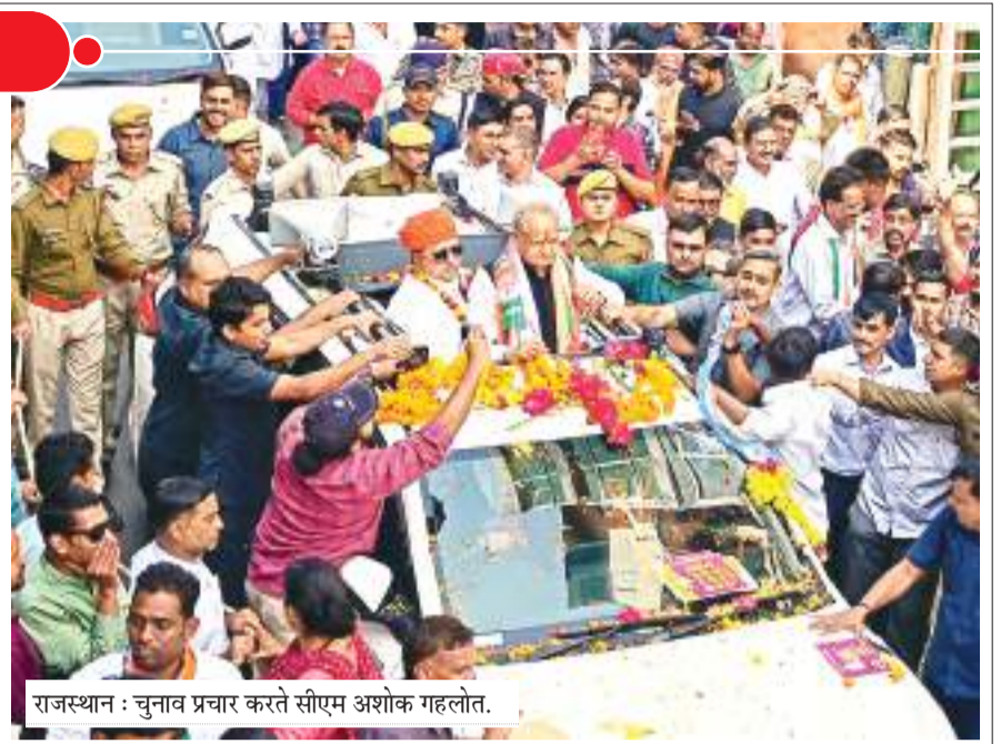
राजस्थान : चुनाव प्रचार करते सीएम अशोक गहलोत.