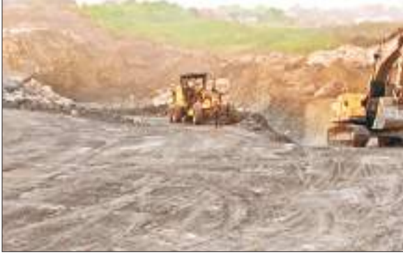
तेतुलमारी परियोजना में ओबी हटाता डोजर.