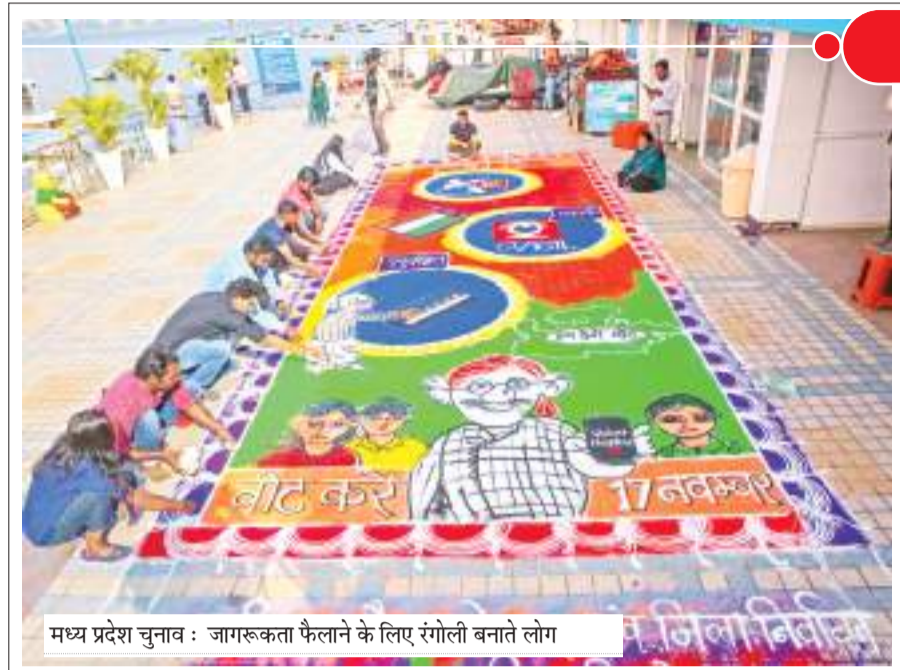
मध्य प्रदेश चुनाव : जागरूकता फैलाने के लिए रंगोली बनाते लोग