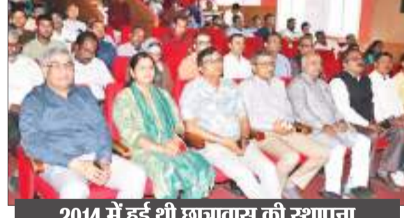
2014 में हुई थी छात्रावास की स्थापना

आईआईटी आईएसएम धनबाद में 192 करोड़ रुपये की लागत से बने एकवामरीन हॉस्टल का आनंदाइन उदघाटन देश के प्रधानमंत्री नरेन्द्र मोदी ने किया। छात्रावास सभी आधुनिक सुविधाओं से सुसज्जित है। आईएसएम धनबाद के लिए यह एक ऐतिहासिक क्षण रहा। प्रधानमंत्री ने समारोह के दौरान एकवामरीन हॉस्टल को समर्पित किया। खूंटी के उलहात से प्रधानमंत्री नरेन्द्र मोदी आनंदाइन जुड़े थे। जिसका सीधा प्रसारण आईआईटी के गोल्डन जुबली लेक्चर थियेटर में किया जा रहा था। समारोह में केन्द्रीय जनजातीय मंत्री अर्जुन मुंडा और झारखंड के मुख्यमंत्री हेमंत सोरेन के लिए भगवान बिरसा ने जो मुहिम छेड़ी थी।