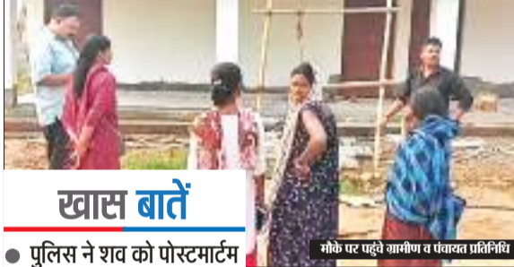
स्कूल पर पहुंचे आरिषी व पंचायत प्रतिनिधि