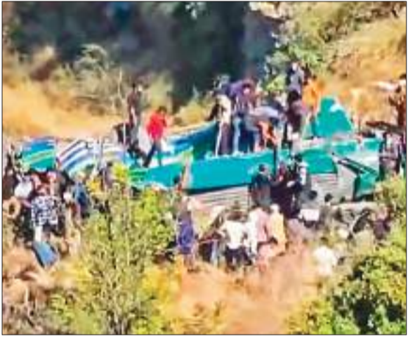
शोक संतप्त परिवारों के प्रति मेरी हार्दिक संवेदनाएं : राज्यपाल

प्रधानमंत्री नरेंद्र मोदी और केंद्रीय गृह मंत्री अमित शाह ने घटना पर दुख जताया है। मोदी ने