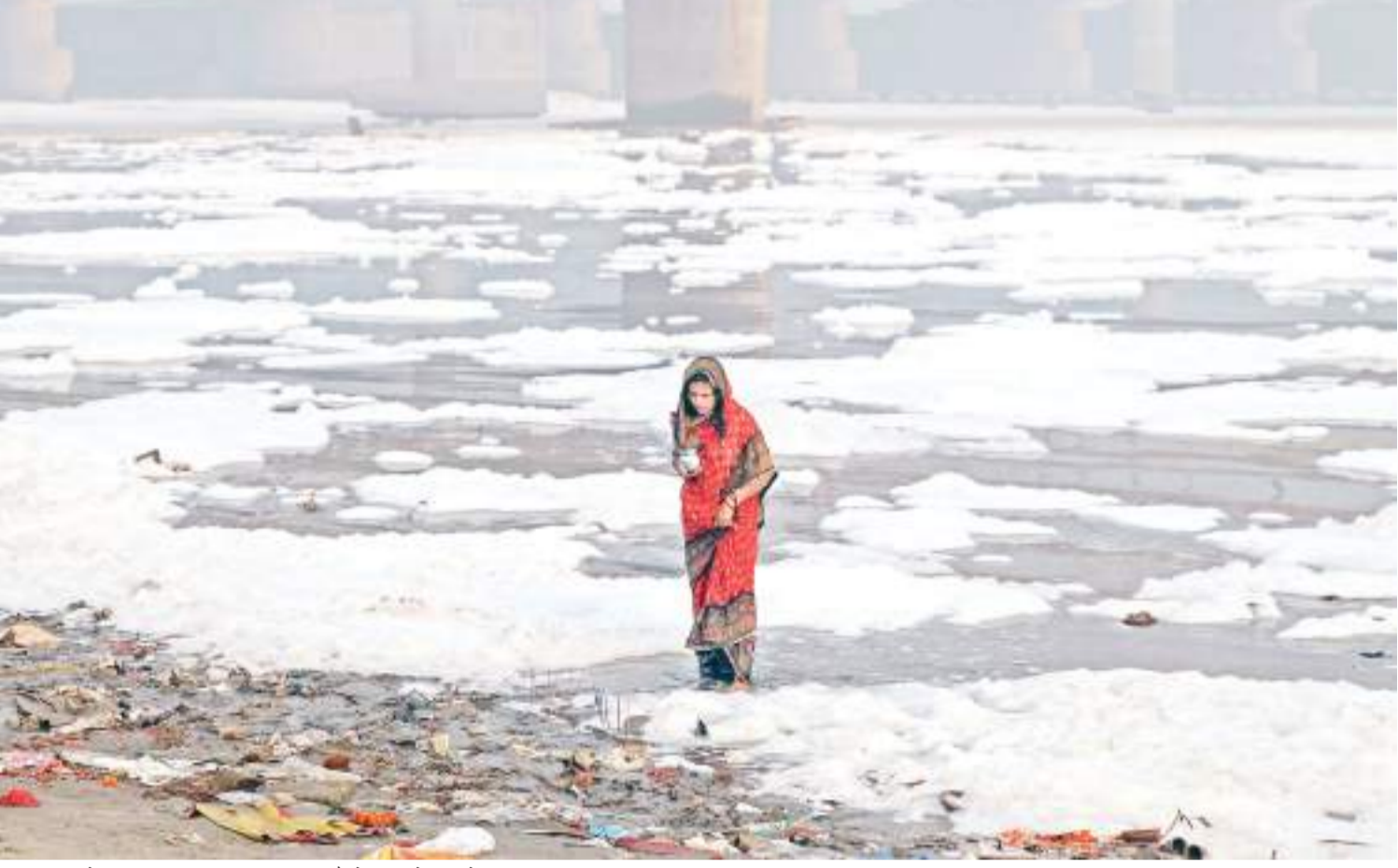
नयी दिल्ली में प्रदूषित यमुना नदी की सतह पर फैले जहरीले झाग के बीच धार्मिक अनुष्ठान करती एक महिला।