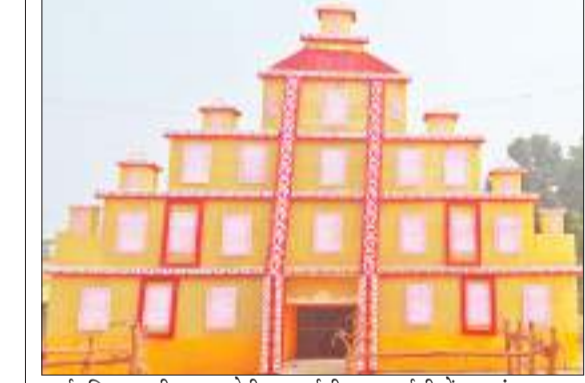
सार्वजनिक काली पूजा कमेटी एमआईजी - एलआईजी में बना पंडाल.