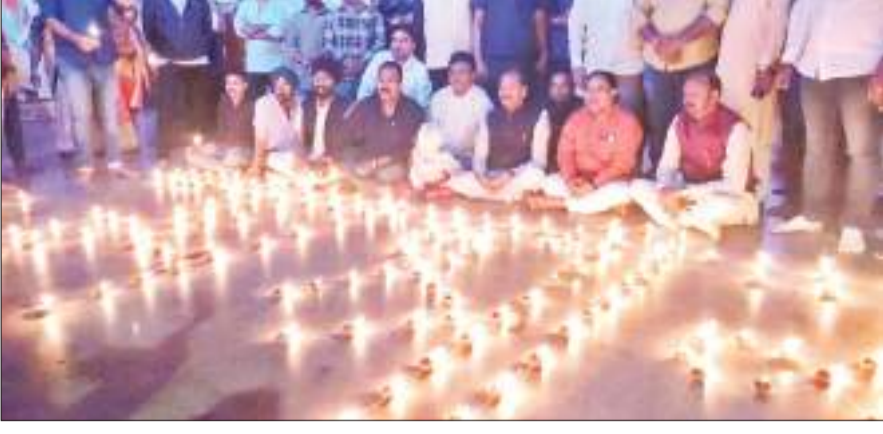
आ रहे थे और ऐसा लगा कि रोशनी ने पूर्णिमा की रात में बदल अमावस्या की काली रात को दीपों की दिया। जैसे-जैसे शाम ढलती गई वैसे-वैसे दीपक भी सुनहली रंगत के साथ जगमगा उठे।

दीपावली की पूर्व संध्या पर सिदगोड़ा स्थित सूर्य मंदिर परिसर को अयोध्या की तर्ज पर रंगबिरंगी लाइटों से सजाया गया है। शनिवार को सूर्य मंदिर समिति की ओर से श्रीराम मंदिर प्रांगण व पूरे मंदिर परिसर में 11 हजार देशी घी के दीये जलाए गए। इसमें बतौर मुख्य अतिथि ओडिशा के राज्यपाल रघुवर दास उपस्थित थे। राज्यपाल रघुवर दास ने मंदिर समिति के सदस्यों के संग दीपक जलाकर दीपावली की खुशियां साझा कीं। इस दौरान हजारों की संख्या में जले दीपों से पूरा मंदिर परिसर जगमगा नजर आया। चारों तरफ दीप ही दीप नजर