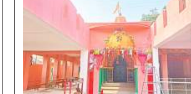
चक्रधरपुर टाउन का काली मंदिर.