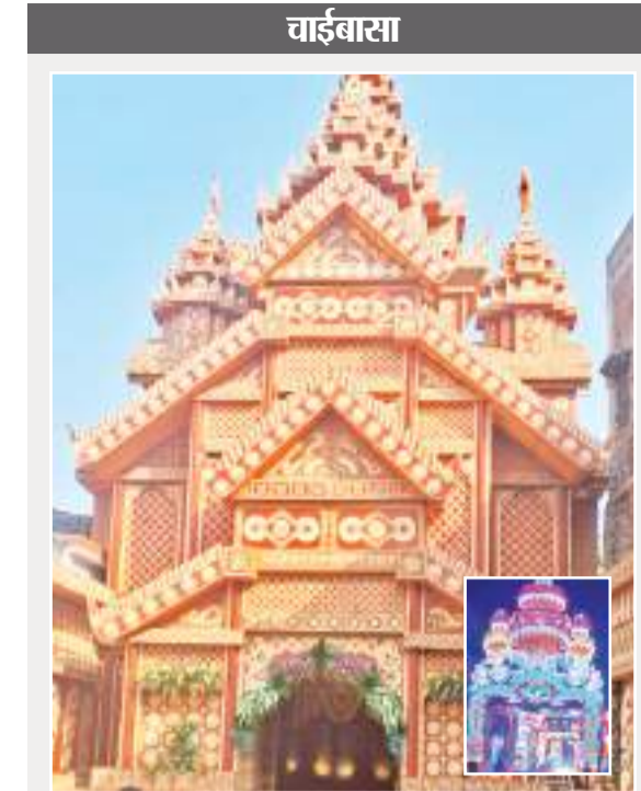
श्री श्री सार्वजनिक काली पूजा समिति अमला टोला.