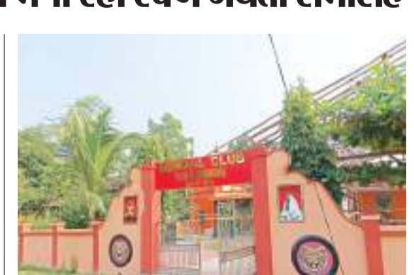
इतवारी बाजार स्थित बंगाल क्लब काली मंदिर.

चक्रधरपुर में प्रत्येक वर्ष श्रद्धा बांध के साथ माता काली पूजा की जाती है. इस वर्ष भी पूजा की तैयारी की गई है. चक्रधरपुर के विभिन्न स्थानों पर माता काली मंदिर के अलावे कई जगहों पर पंडाल का निर्माण कर पूजा अर्चना की जाती है. आमवस्था पर होने वाली काली पूजा में देर रात श्रद्धालु मंदिर व पूजा पंडाल में पूजा अर्चना के लिए जुटे रहते हैं. चक्रधरपुर के इतवारी बाजार के समीप स्थित बंगाल काली पूजा समिति इस वर्ष स्वर्ण जयंती समारोह मना रहे हैं.यहां वर्ष 1963 से मंदिर में माता काली की पूजा अर्चना की जाती रही है. इस वर्ष स्वर्ण जयंती समारोह पर भक्ति कार्यक्रम के साथ-साथ अन्य कार्यक्रम आयोजित किए जा रहे हैं. जहां विभिन्न जगहों से पहुंचकर गावक, कलाकार पहुंचकर अपनी प्रस्तुती देंगे. स्वर्ण जयंती समारोह को लेकर आकर्षक साज सज्जा की गई है.यहां चक्रधरपुर के रमशान काली मंदिर, टाउन काली मंदिर, पॉटरखोली काली मंदिर, रिम्पुजी कॉलोनी स्थित काली मंदिर, आरूई कॉलोनी काली मंदिर, टोकली रोड स्थित काली मंदिर, रितायर्ड कॉलोनी काली मंदिर समेत अन्य कई मंदिरों में पूजा अर्चना की जाएगी.वहीं चक्रधरपुर के रेवेले स्टेशन, इतवारी बाजार, लोको कॉलोनी, बीएसएनएल कार्यालय के समीप सहित अन्य प्रतिभा स्थापित कर माता