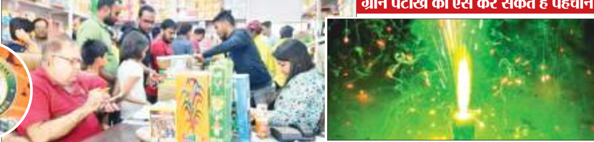
ग्रीन पटाखे की ऐसे कर सकते हैं पहचान

दीपावली में प्रदूषण ज्यादा ना बढ़े इसके लिए लोग अब काफी जागरूक हुए हैं और उनका रुझान ग्रीन पटाखों की तरफ ज्यादा है। ग्राहक इस बार खासकर इको फ्रेंडली ग्रीन पटाखों की मांग कर रहे हैं। इधर, पर्यावरण में बढ़ते प्रदूषण को देखते हुए एक तरफ जहां सरकार और जिला प्रशासन जागरूकता के लिए कई अभियान चला रहे हैं। वहीं पटाखों से फैलने वाले प्रदूषण पर नियंत्रण रखने के लिए प्रदूषण नियंत्रण बोर्ड ने झारखंड में सिर्फ दो घंटे आतिशबाजी करने की छूट दी है।