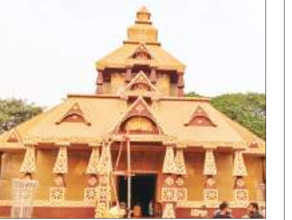
शक्ति क्लब काली पूजा समिति, न्यू एजी कॉलोनी कडरू.