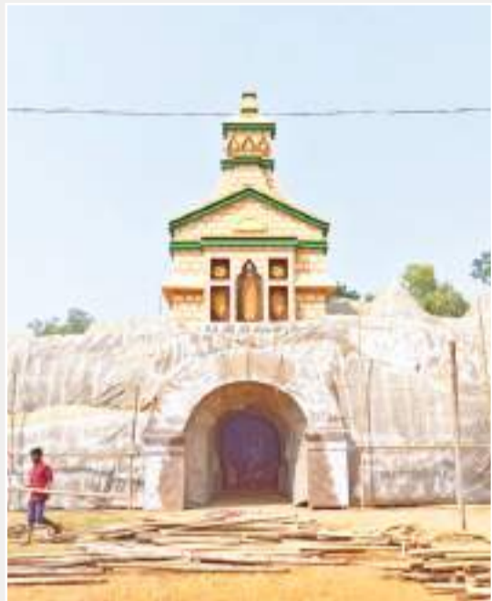
बहरागोड़ा काली संघ क्लब, पाटनपुर सार्वजनिक काली पूजा कमेटी