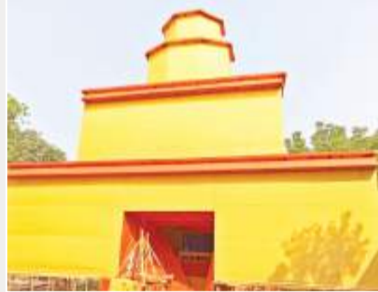
मां तारा संघ, बहरागोड़ा रमशान काली पूजा कमेटी का पंडाल