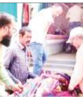
कट गया है। स्थानीय लोगों को मदद से उस महिला को सामुदायिक स्वास्थ्य केंद्र, बरवाडीह में भर्ती कराया गया। जहां चिकित्सकों ने उसका प्राथमिक इलाज किया। उसे बेहतर इलाज के लिए एम्पएमसीएच मेडिनीनगर रेफर कर दिया गया। चिकित्सकों के अनुसार महिला खतरे से बाहर है।