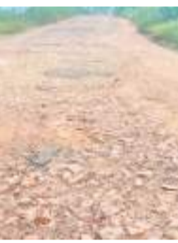
इससे ग्रामीणों में आक्रोश है। यह सड़क भातकुंडा, रांगामाटिया

चाकुलिया- धालभूमगढ़ मुख्य सड़क के पीडी बागान से भातकुंडा जाने वाली सड़क इतनी जर्जर है कि इस पर पैदल चलना भी मुश्किल है। सड़क पर गड्डों की भरमार है और नुकीले पत्थर उभर आए हैं। वर्षों से इस सड़क की मरम्मत नहीं हुई है। इससे भातकुंडा पंचायत के कई गांव के ग्रामीण परेशानियां झेल रहे हैं। ग्रामीण इसकी मरम्मत की मांग विगत कई साल से कर रहे हैं। परंतु इस दिशा में कोई पहल नहीं हुई है।