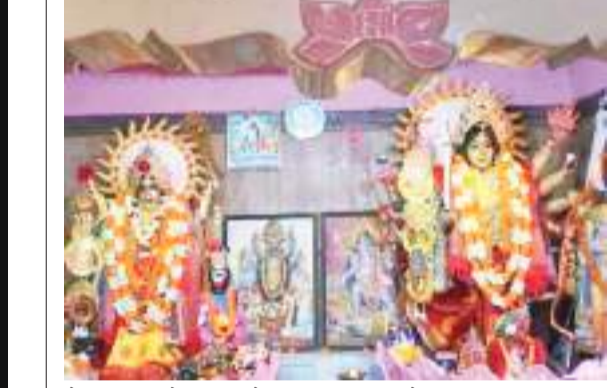
जेसी मलिक रोड स्थित नेपाली काली मंदिर में मां की प्रतिमा.