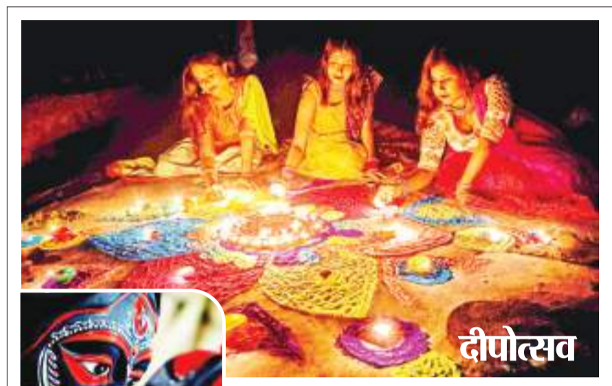
दीपोत्सव दीपों का पर्व दिवाली आज देशभर में धूमधाम से मनाया जाएगा। यह पर्व असत्य पर सत्य की जीत का संदेश देता है। झारखंड में दिवाली की धूम नजर आ रही है। बच्चों में खासा उत्साह नजर आ रहा है। आज आधी रात को माता काली की भी पूजा-अर्चना की जाएगी। कई स्थानों पर आकर्षक पूजा पंडाल बनाए गए।