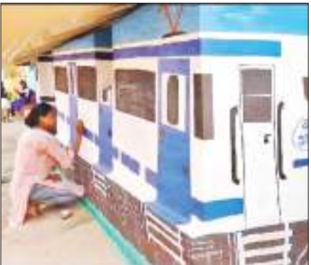
गयी वंदे भारत एक्सप्रेस लोगों को आकर्षित कर रही है। बता दें कि संथाल समाज सोहराय पर्व को प्रमुखता से मनाते हैं। पांच दिनों तक मनाया जाने वाला यह पर्व कृषि से जुड़ा हुआ है। घरों का रंग-रोगन करना व सजाना उनकी परंपरा है। इस पर्व में कृषि में साथ देने वाला पशु और नये फसल की पूजा होती है।

सोहराय पर्व को लेकर क्षेत्र में उत्साह का माहौल है। आदिवासी समाज के इस महान पर्व को लेकर पूरे क्षेत्र में तैयारी अंतिम चरण में है। सोहराय पर्व पर ग्रामीण अपने घरों को खूबसूरत अंदाज में सजाते हैं। मिट्टी से बने रंगों से अपने घरों के बाहर मनमोहक कलाकृति उकेरी जाती है। जिनकी चमक महंगे रंगों की तरह होती है। इस बार जमशेदपुर से सटे ग्रामीण क्षेत्र जोंद्रागोड़ा गांव की एक छात्रा ने सोहराय पर अपने मिट्टी के घर को वंदे भारत एक्सप्रेस ट्रेन का रूप दिया है। मिट्टी के रंगों से झोपड़ी में बनायी