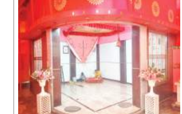
श्री श्री 108 अखंड ज्योति काली मंदिर