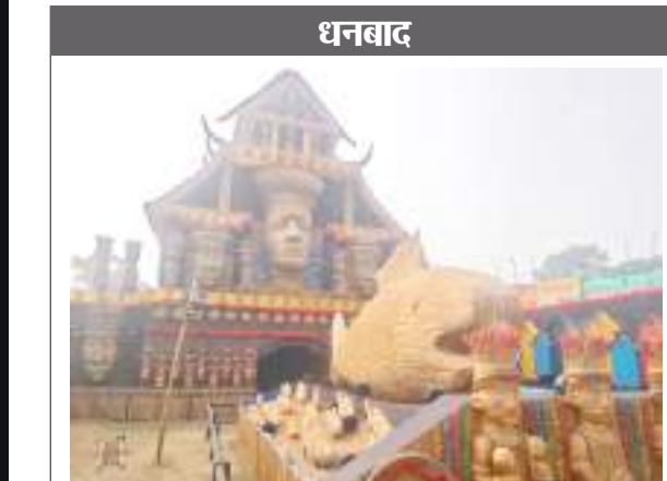
हीरापुर पार्क मार्केट में बना काली पूजा पंडाल.