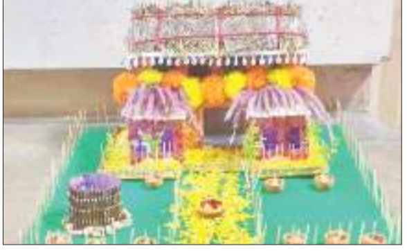
वे हुए पुरस्कृत

तीन दिवसीय यह फेस्ट 8 से 10 नवंबर तक चला, जिसमें पहले दिन 8 नवंबर को दिया सजावट, तोरण मेकिंग प्रतियोगिता, दूसरे दिन 9 नवंबर को दिवाली घर मेकिंग प्रतियोगिता एवं अंतिम दिन शनिवार