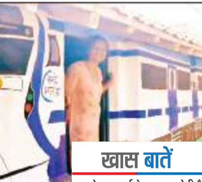
यह पर्व कृषि से जुड़ा हुआ है। घरों का रंग-रोगन करना व सजाना उनकी परंपरा है। इस पर्व में कृषि में साथ देने वाला पशु और नये फसल की पूजा होती है।