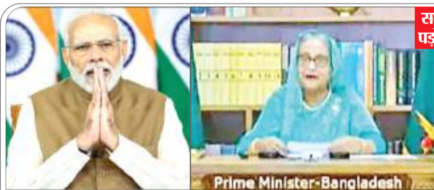
वीडियो कॉन्फ्रेंस के जरिये परियोजनाओं का उद्घाटन करते पीएम मोदी और बांग्लादेश की पीएम शेख हसीना।

सफलता का जश्न मनाने एक बार फिर जुड़े : मोदी ने वीडियो कॉन्फ्रेंस के जरिए हसीना के साथ बातचीत में कहा कि यह खुशी की बात है कि हम भारत-बांग्लादेश सहयोग की सफलता का जश्न मनाने के लिए एक बार फिर जुड़े हैं। उन्होंने कहा कि हमारे संबंध निरंतर नयी ऊंचाइयों छू रहे हैं। मोदी ने कहा कि सीमा पर शांति, सुरक्षा और स्थिरता की बहाली के लिए दोनों देशों के बीच दशकों से लंबित, जमीन सीमा समझौता किया गया और समुद्री सीमा संबंधी मामलों को भी सुलझाया गया।