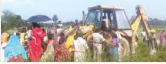
घटनास्थल पर मौजूद ग्रामीण और पुलिस के जवान।

आदित्यपुर औद्योगिक क्षेत्र के नियर 7 फेज से सटे हथियाडीह में उद्योग विस्तार का हथियाडीह के ग्रामीणों ने जबरदस्त विरोध किया है। बुधवार को जमीन की घेराबंदी करने पहुंची जेसीबी को ग्रामीणों ने घेरा लिया और उसे क्षतिग्रस्त करने का प्रयास किया। जमीन जियाडा द्वारा जमुना ऑटो प्राइवेट लिमिटेड को आवंटित की गई है। इस जमीन को ग्रामीण खेल का मैदान बता रहे हैं। ग्रामीणों का आरोप है कि जियाडा ने वर्षों पुरानी हथियाडीह फुटबॉल मैदान के जमीन को जमुना ऑटो प्राइवेट लिमिटेड को