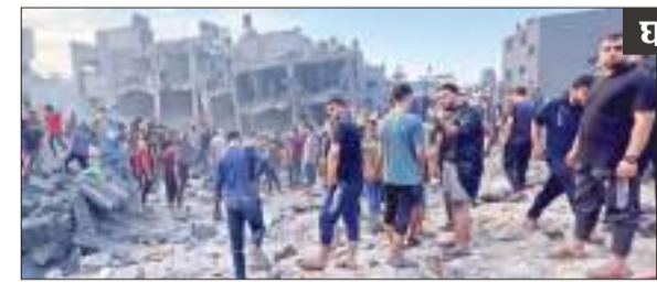
इजराइली हवाई हमले के बाद जीवित बचे लोगों व शवों को निकालते लोग।

इजराइली सेना द्वारा मंगलवार को किए गए हवाई हमलों ने गाजा शहर के समीप एक शरणार्थी शिविर में अपार्टमेंट इमारतों को ध्वस्त कर दिया। इस दौरान सामने आई फुटेज में बचावकर्मी पुरुषों, महिलाओं और बच्चों को मलबे से बाहर निकालते हुए दिखे। इजराइल ने कहा कि हमले में घुरों में स्थापित हमास के कमांड सेंटर और नीचे फेले सुरंगों के नेटवर्क को नष्ट कर दिया गया। जबालिया शिविर पर हुए हमले में मृतकों की तत्काल जानकारी साझा नहीं की गई है। वहीं, इजराइली सेना ने कहा कि उत्तरी