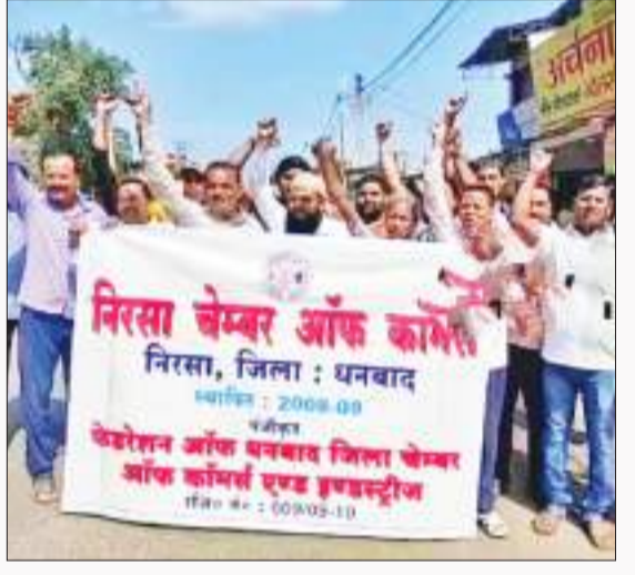
निरसा चेंबर ऑफ कॉमर्स के सदस्यों का एक कार्यक्रम।