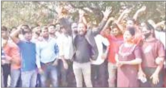
राज्य सरकार के खिलाफ नारेबाजी करते हजारीबाग मटवारी स्थित गांधी मैदान में गोलबंद विद्यार्थी।