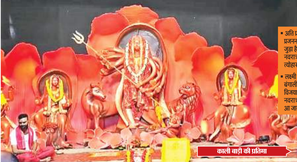
काली बाड़ी की प्रतिमा