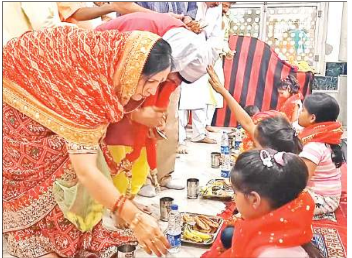
धनबाद शक्ति मंदिर में महाष्टमी पूजा के दौरान कन्या पूजन करते श्रद्धालु.

दुखी हो जाता है. आज धनुकी नाच में बच्चे नहीं कुछ बच्चे हुए चुनिंदा बुजुर्ग ही नाचते हैं. ढाकी से ढाक छीनने वाला भी कोई नहीं. शायद आधुनिकता के होड़ में हम अपना गौरवशाली कल को खोते जा रहे हैं.