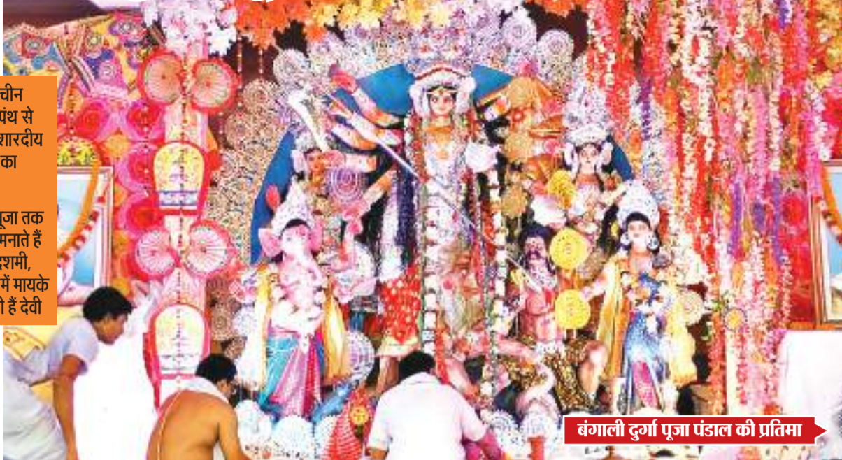
बंगाली दुर्गा पूजा पंडाल की प्रतिमा

■ अति प्राचीन प्रजनन पंथ से जुड़ा है शारदीय नवरात्र का त्योहार ■ लक्ष्मी पूजा तक बंगाली मनाते हैं विजयादशमी, नवरात्र में मायके आ जाती हैं देवी