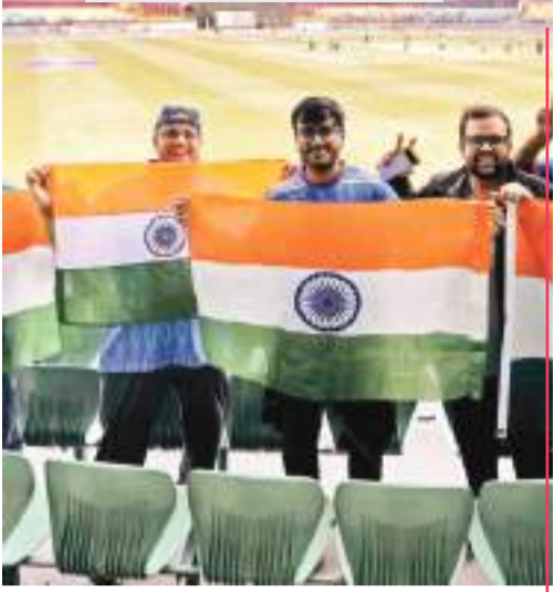
धर्मशाला। भारत और न्यूजीलैंड के मैच के दौरान भारतीय टीम का समर्थन करते खेलप्रेमी।