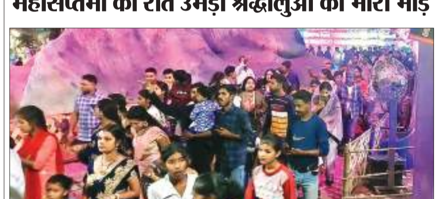
आदित्यपुर। दुर्गात्सव पर आदित्यपुर में महासप्तमी की रात श्रद्धालुओं की भारी भीड़ उमड़ी.

पंडालों में पैर रखने की भी जगह नहीं थी. श्रद्धालुओं की भीड़ खरकई पुल से ही हो रही थी. श्रद्धालुओं की लाइन खरकई पुल से लगनी शुरू हो गई, जिसे संभारने में जिला प्रशासन के लोगों और कमेटी के वोलंटियर्स के पसीने छूटने लगे. श्रद्धालुओं की भीड़ पर नियंत्रण के लिए जिला प्रशासन द्वारा बनाए गए वॉच टावर से प्रशासन के आला अधिकारी नजर रख रहे थे. श्रद्धालुओं की भीड़ को देखते हुए ट्रैफिक विभाग को शाम 4 बजे से आटो और सभी प्रकार के कॉमर्शियल वाहनों के प्रवेश पर रोक लगायी पड़ी. इसके बाद सड़कों पर उमड़ी श्रद्धालुओं की भीड़ को नियंत्रित करने में प्रशासन को सफलता मिली. जिला शांति समिति के वॉच टावर पर कल रात एसडीएम