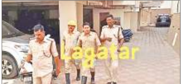
अपार्टमेंट का जायजा लेती फायर डिपार्टमेंट व पुलिस की टीम.

धनबाद के बैंक मोड़ थाना क्षेत्र के शास्त्री नगर स्थित गैलेक्सी अपार्टमेंट में रविवार की सुबह कन्या पूजन का भोग बनाने के दौरान अचानक आग लग गई। धुआं देख पूरे अपार्टमेंट में अफरा-तफरी मच गई। गृहस्वामी और अपार्टमेंट के कुछ लोगों ने सूझबूझ का परिचय देते हुए अपार्टमेंट में लगे फायर सेफ्टी सिस्टम के सहारे आग पर काबू पा लिया। जिससे बड़ा हादसा टल गया। वहीं, गृहस्वामी ने आग लगने की सूचना अग्निशमन विभाग और बैंक मोड़ थाना को फोन कर दे दी। बैंक मोड़ पुलिस और अग्निशमन ब्रिगेड की टीम दो दमकल गाड़ी के साथ मौके पर पहुंची और जायजा लिया। गृहस्वामी ने बताया कि घर में दुर्गा पूजा हो रही है।