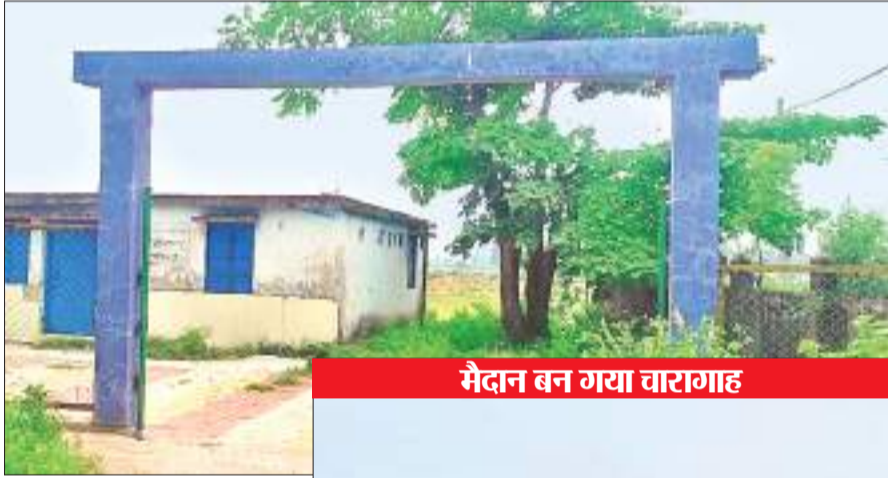
मैदान बन गया चारागाह