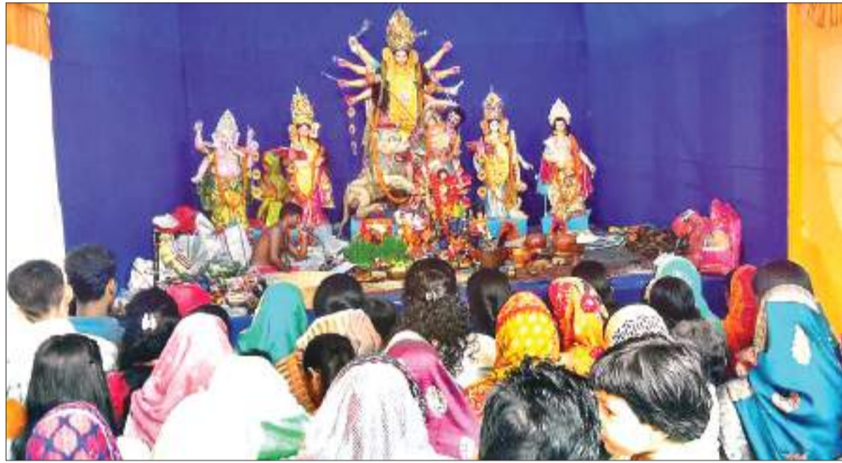
जमशेदपुर के एक पूजा पंडाल में रविवार को महाष्टमी के मौके पर पूजा-अर्चना करते श्रद्धालु.