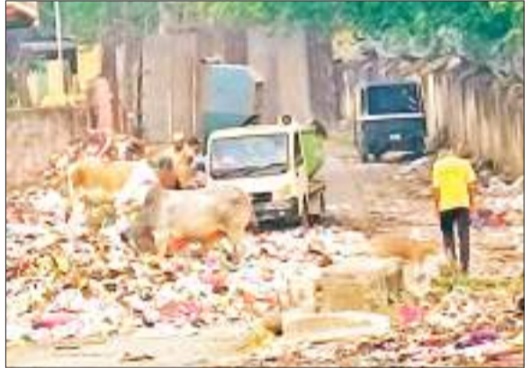
बिरसा मुंडा टाउन हॉल के पीछे कचरा का अंबार.