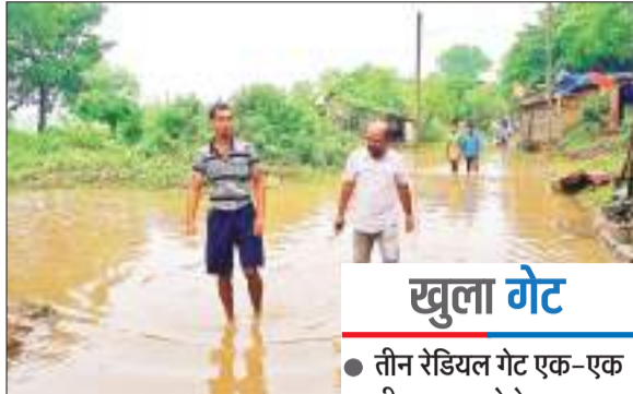
गेट को एक-एक मीटर तक खोला गया था। इसके बाद डैम का जलस्तर तेजी से घटता गया।

चांडिल डैम का जलस्तर घटने के बाद मंगलवार की सुबह सात रेडियल गेट बंद कर दिए गए हैं। फिलहाल डैम का तीन रेडियल गेट को एक-एक मीटर तक खोल कर रखा गया है। मंगलवार की सुबह चांडिल डैम का जलस्तर 181.50 मीटर दर्ज किया गया। इससे चांडिल डैम के किनारे डूब क्षेत्र में रहने वाले विस्थापित परिवारों ने राहत की सांस ली है। डैम का जलस्तर 181.85 मीटर के पार चले जाने के बाद डैम के 10 रेडियल गेटों को खोल दिया गया था। इनमें आठ गेट को डेढ़-डेढ़ मीटर और दो