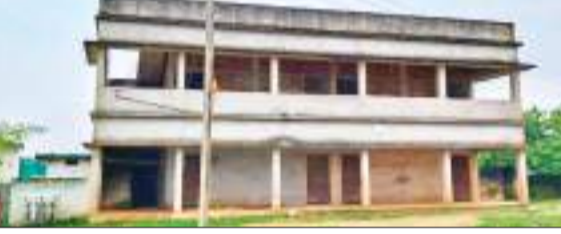
गावां प्रखंड के पिहरा में अधूरा पड़ा प्राथमिक विद्यालय का भवन