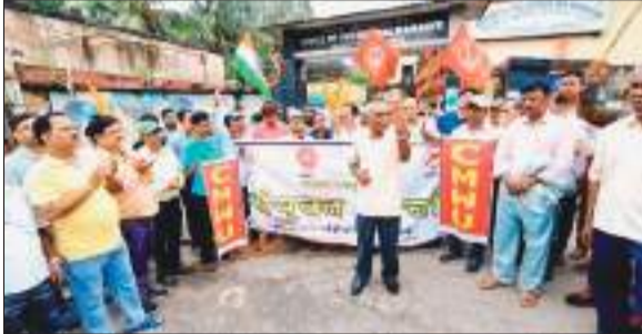
प्रदर्शन करते यूनियन के पदाधिकारी व सदस्य.