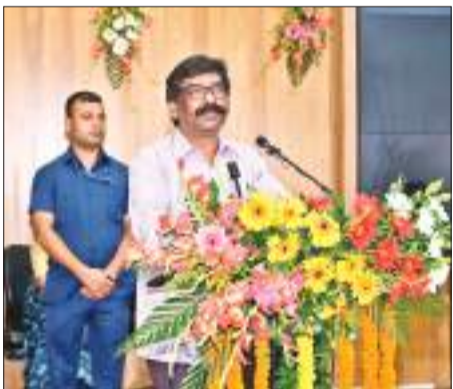
प्रोजेक्ट भवन सभागार में कार्यक्रम को संबोधित करते सीएम हेमंत सोरेन और नियुक्ति पत्र के साथ युवा।