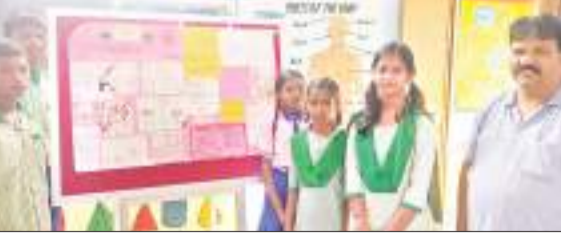
मध्य विद्यालय में दीवार पत्रिका के साथ बच्चे एवं प्रधानाध्यापक