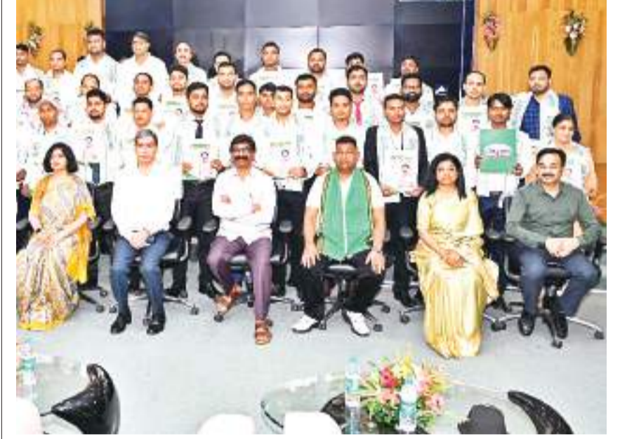
मुख्यमंत्री हेमंत सोरेन ने मंगलवार को नगर विकास एवं आवास विभाग के अंतर्गत झारखंड नगरपालिका सेवा के 47 सहायक अभियंता (असैनिक/यांत्रिक/विद्युत) तथा वाणिज्य कर विभाग के तहत लिपिकीय सेवा संवर्ग के 46 निम्नवर्गीय लिपिक के पद पर चयनित अभ्यर्थियों को नियुक्ति पत्र वितरित किए. -संबंधित समाचार पेज 10 पर देखें