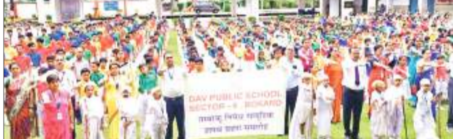
डीएवी पब्लिक स्कूल सेक्टर छह में आयोजित कार्यक्रम में तंबाकू निषेध की शपथ लेते बच्चे व शिक्षकगण