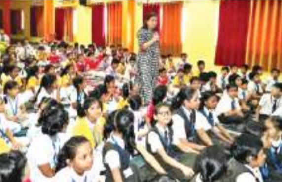
बच्चों को गुड टच और बैड टच के बारे में बताती रिसोर्स पर्सन.

मानगो स्थित आरवीएस अकादमी के सेफ क्लब ने सीआईआई यंग इंडियंस के साथ मिलकर मंगलवार को पहली से पांचवी कक्षा तक के छात्रों के लिए गुड टच और बैड टच पर जागरूकता कार्यक्रम का आयोजन किया। यह सत्र बाल सुरक्षा पर जागरूकता पैदा करने के लिए आयोजित किया गया था। छात्रों को गलत और सही के बीच अंतर समझने में मदद करना और उन्हें शोषण से बचना इस कार्यक्रम का मुख्य उद्देश्य था।