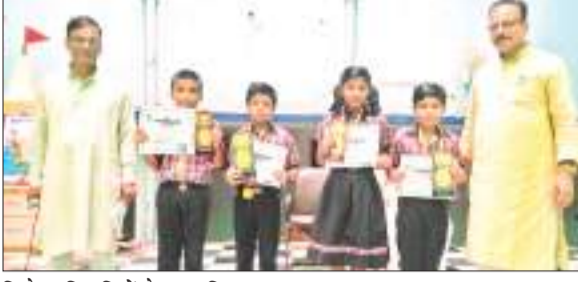
विजेताप्रतिभागियों के साथ शिक्षक