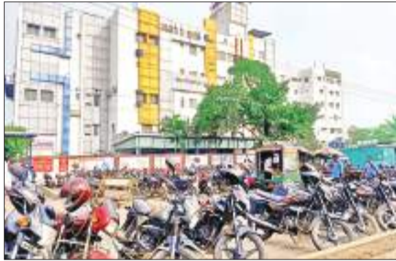
सड़क पर वाहनों की पार्किंग का नजारा

वर्षों से है एसडीएम बंगला के आगे अतिक्रमण : शहर के हीरापुर क्षेत्र में पुलिस लाइन से डीआरएम बिल्डिंग तक फल, सब्जी और फूल की दुकानों के साथ ठेले खोमचे भी लगते हैं। कोर्ट आने वाले लोगों की गाड़ियां भी उसके आगे खड़ी हो जाती हैं। लगभग 30 फीट की सड़क 10 फीट में सिकुड़ जाती है। हरिया मोड़ से एडीएम बंगला तक सड़क के दोनों ओर फुटपाथ से लेकर कई बिल्डिंग की सौंझियां भी सड़क की जमीन पर बनी हुई हैं।