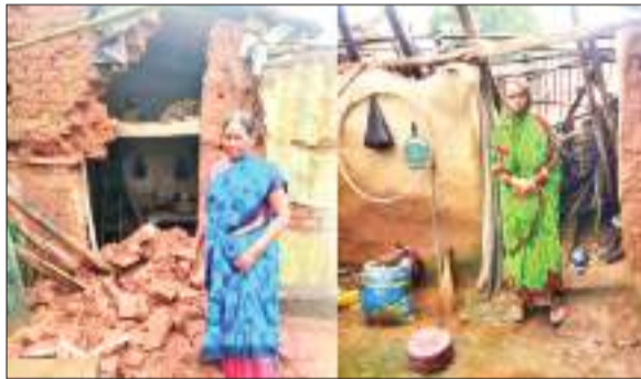
शक्तिप्रस्त हुए आवास।