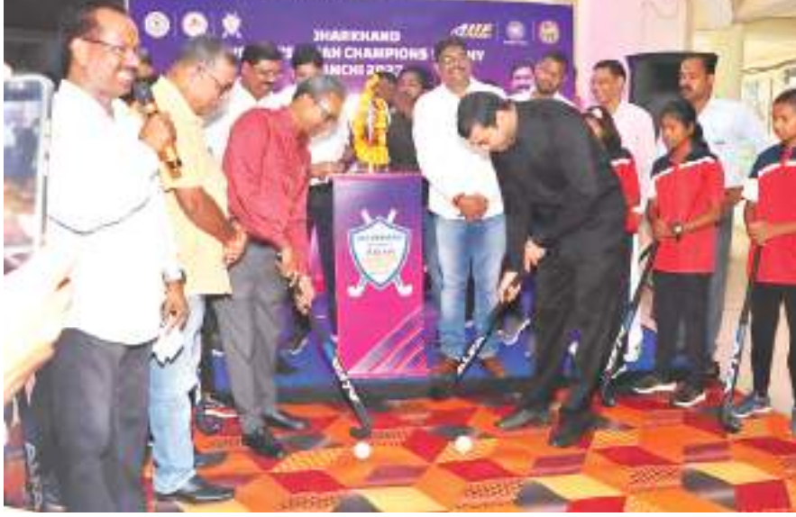
पदाधिकारियों के साथ खिलाड़ियों ने उत्साह के साथ ट्रॉफी का स्वागत किया।