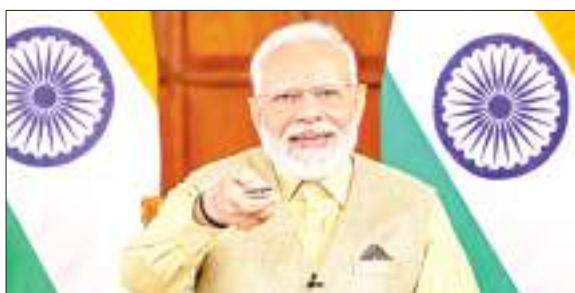
वीडियो कॉन्फ्रेंस के माध्यम से जीएमआईएस 2023 के उद्घाटन में शामिल हुए पीएम।

प्रधानमंत्री नरेन्द्र मोदी ने मंगलवार को 23,000 करोड़ रुपये की समुद्री परियोजनाओं की शुरुआत की और इसके साथ ही नीली अर्थव्यवस्था के लिए दीर्घकालिक दृष्टि दस्तावेज जारी किया। एक आधिकारिक बयान के अनुसार इसमें बंदरगाह सुविधाओं में वृद्धि, सतत प्रथाओं का बढ़ावा और अंतरराष्ट्रीय सहयोग को सुविधाजनक बनाए जाने के मकसद से रणनीतिक पहल की रूपरेखा तैयार की गई है। उन्होंने 'ग्लोबल मैरिटाइम डेवेलपमेंट' के तीसरे संस्करण के दौरान भारतीय समुद्री नीली अर्थव्यवस्था के लिए 23,000 करोड़ रुपये से अधिक की परियोजनाओं का उद्घाटन कर उन्हें राष्ट्र को समर्पित किया या उनका शिलान्यास किया। इस शिखर सम्मेलन में भविष्य के पतनों सहित समुद्री क्षेत्र से जुड़े प्रमुख मुद्दों पर चर्चा की जाएगी। इसके अलावा बैठक में कार्बन में कटौती (डि कार्बोनाइजेशन), तटीय जहाजनाओ और अंतरदेशीय जल परिवहन, पोत निर्माण, वित्त, समुद्री पर्यटन आदि मुद्दों पर भी चर्चा की जाएगी। प्रधानमंत्री मोदी ने गुजरात के दीनदयाल पत्तन प्राधिकरण में करीब 4,500 करोड़ रुपये की लागत से बनने वाले टूना-टेकरा टर्मिनल की नींव रखी। इस ग्रीनफील्ड टर्मिनल