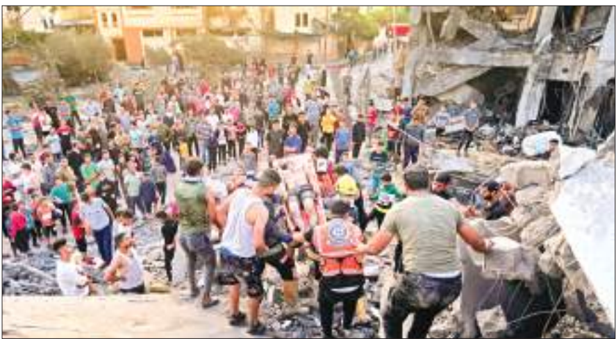
दक्षिणी गाजा पट्टी के खान यूनिश शहर में इजराइली हवाई हमले से नष्ट हुए घर।

लेबनान और इजराइल की सीमा पर मंगलवार को फिर संघर्ष छिड़ गया। गाजा में लड़ाई शुरू होने के साथ ही इजराइल और लेबनान के सशस्त्र समूहों के बीच छिपटू झड़पें शुरू हो गयीं थीं। मंगलवार सुबह लेबनान से दागी गयी एंटी टैंक मिसाइल उत्तरी इजराइल के मेटुला में गिरी और तीन लोग घायल हो गये। साफिद में 'जीव मेडिकल सेंटर' ने यह जानकारी दी। लेबनान के किसी संगठन ने तत्काल इस मिसाइल हमले की जिम्मेदारी नहीं ली है। वैसे यह स्पष्ट नहीं हो पाया कि इस मिसाइल हमले में घायल हुए लोग आम नागरिक हैं या सैनिक, लेकिन इजराइल लेबनान सीमा से सटे क्षेत्रों में रह रहे लोगों को इलाके को खाली करने का आदेश दे चुका है। इजराइल ने दक्षिणी लेबनान में सीमावर्ती क्षेत्रों में कई गोले दागे और व्हाइट फॉस्फोरस छोड़ा। लेबनान की सरकारी समाचार समिति नेशनल न्यूज एजेंसी ने यह खबर दी। इजराइल की सेना ने कहा कि सीमा पार से एंटी टैंक मिसाइल दागे जाने के बाद उसके टैंकों ने जवाबी कार्रवाई की। मंगलवार को उससे पहले इजराइली सेना ने कहा था कि उसने उन चार आतंकवादियों को मार गिराया जिन्होंने इजराइल और लेबनान के बीच की दीवार में विस्फोट लगाते की कोशिश की थी। फिलिस्तीनियों ने किया दक्षिणी गाजा में भीषण बमबारी का दावा : तेल अवीव। गाजा में फिलिस्तीनियों ने मंगलवार को तटके खान यूनिश और रफ़ाह के दक्षिणी शहरों के पास भीषण बमबारी किए जाने का दावा किया। हालांकि, अभी तक हताहत होने वालों की संख्या के बारे में कोई जानकारी उपलब्ध नहीं कराई गई है। स्थानीय खबरों के अनुसार, इजराइल की ओर से खान यूनिश के पश्चिम और दक्षिण-पूर्व