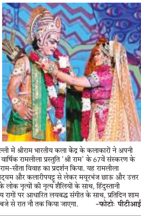
नई दिल्ली में श्रीराम भारतीय कला केंद्र के कलाकारों ने अपनी प्रसिद्ध वार्षिक रामलीला प्रस्तुति 'श्री राम' के 67वें संस्करण के दौरान राम-सीता विवाह का प्रदर्शन किया. यह रामलीला भरतनाट्यम और कलारीपयट्टु से लेकर मयूरभंज छाऊ और उत्तर भारत के लोक नृत्यों की नृत्य शैलियों के साथ, हिंदुस्तानी शास्त्रीय रागों पर आधारित लयबद्ध संगीत के साथ, प्रतिदिन शाम 6.30 बजे से रात नौ तक किया जाएगा.