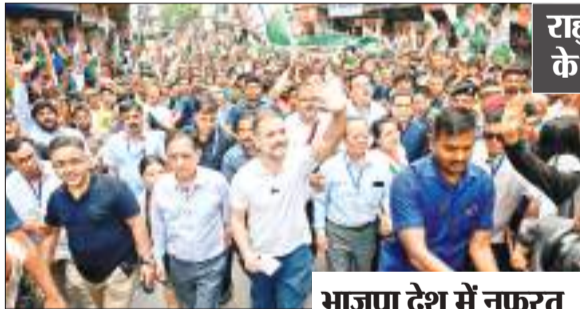
राहुल ने त्रिपुरा प्रदेश कांग्रेस के नेताओं के साथ बैठक की

प्रधानमंत्री नरेंद्र मोदी मणिपुर से ज्यादा इजराइल की घटनाओं से चिंतित हैं. प्रधानमंत्री और भारत सरकार को इजरायल-हमारा संघर्ष में दिलचस्पी है, लेकिन मणिपुर में क्या हो रहा है, उसकी कोई चिंता नहीं है. यह आरोप कांग्रेस नेता राहुल गांधी ने आज सोमवार को यहां आयोजित एक चुनावी रैली में लगाया. बता दें कि मिजोरम विधानसभा के लिए चुनाव सात नवंबर को होंगे. मतगणना तीन दिसंबर को होगी.