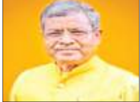
संकल्प यात्रा जनता के अपार समर्थन से जन संकल्प यात्रा में बदल गई। आठ चरणों में 71 विधानसभा में हो चुकी है यात्रा : उन्होंने बताया कि अब तक 71 विधानसभा क्षेत्र में यह यात्रा आठ चरणों में संपन्न हो चुकी है।