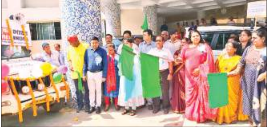
जागरुकता रथ को हरी झंडी दिखाकर रवाना करतीं डीसी।

जिले के डीएल परिसर से राईडा चौक तक बाल विवाह की रोकथाम के लिए जन जागरुकता