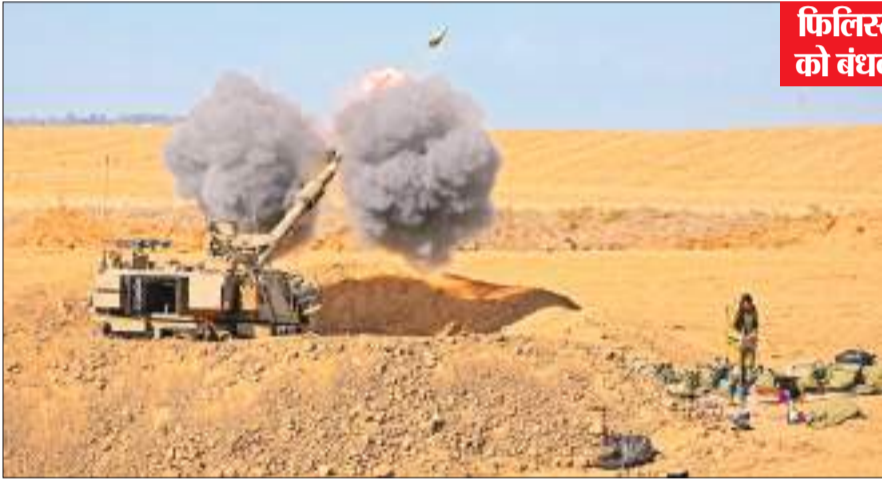
दक्षिणी इजराइल से गाजा पट्टी की ओर एक गोला दागती इजराइली तोपखाना इकाई की सेना.

वैटिकन सिटी में रविवार को प्रार्थना की समाप्ति के बाद ईसाई समुदाय के सबसे बड़े धर्मगुरु पोप फ्रांसिस ने मानवाधिकारों की याद दिलाते हुए गाजा में हिंसा रोकने की अपील की. कहा कि इजराइल और फिलिस्तीन में जो हुआ है, उसे लेकर मुझे बहुत दर्द है. बता दें कि पोप फ्रांसिस का यह बयान इजराइल द्वारा गाजा की घेराबंदी किये जाने के कुछ दिनों के बाद आया. बता दें कि गाजा से अब तक 4 लाख लोग पलायन कर गये हैं. सैकड़ों लोग मारे गये हैं. पोप फ्रांसिस के हिंसा रोकने की अपील वाले बयान की इजराइल ने निंदा की है. पोप फ्रांसिस द्वारा गाजा को लेकर चिंता जताये जाने पर इजराइल ने आपत्ति दर्ज जताई है. इस संबंध में इजराइल के विदेश मंत्री एली कोहेन ने कहा, इजराइल यह उम्मीद करता है कि वैटिकन सिटी अपनी स्पष्ट राय के साथ सामने आये. पोप को बिना किसी लाग-लपेट के हमारा द्वारा इजराइल के बेगुनाह लोगों की हत्या की निंदा करनी चाहिए. कहा कि हमारा से महिलाओं, बच्चों और बुजुर्गों तक को नहीं छोड़ा. ये हत्याएं सिर्फ इसलिए की गयी, क्योंकि वे लोग यहूदी और इजराइल के नागरिक थे. एली कोहेन ने कहा, हम यह स्वीकार नहीं कर सकते. वैटिकन सिटी ने अपने बयान में मुख्य तौर पर गाजा के नागरिकों को लेकर ही चिंता जताई. और ऐसा तब है, जब इजराइल के 1300 लोगों की हत्या कर दी गयी है. हम अभी उसका दुख मना रहे हैं. हमारा ने इजराइल के 155 नागरिकों को बंधक बना लिया है. इनमें अमेरिका और ब्रिटेन के भी