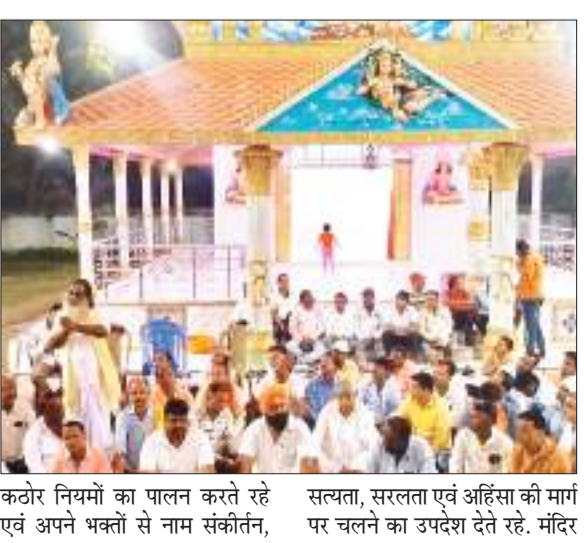
कठोर नियमों का पालन करते रहे सत्यता, सरलता एवं अहिंसा की मार्ग एवं अपने भक्तों से नाम संकीर्तन, पर चलने का उपदेश देते रहे। मंदिर