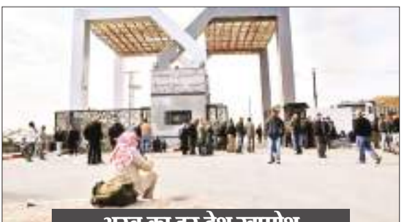
अरब का हर देश खामोश

अमेरिका में राष्ट्रपति पद के चुनाव में रिपब्लिकन पार्टी की ओर से दावेदार निक्की हेली ने इजराइल की ओर से गाजा में जमीनी कार्रवाई की आशंका के बीच वहां से पलायन करके सुरक्षित स्थानों पर जाने की इच्छा रखने वालों के लिए अपने देश के दरवाजे नहीं खोलने के लिए इस्लामिक देशों की निंदा की है. हेली ने पूर्व में ईरान के साथ हुए परमाणु समझौते के लिए पूर्व राष्ट्रपति बराक ओबामा और मौजूदा राष्ट्रपति जो बाइडन की आलोचना की, साथ ही तेहरान पर हमारा और हिज्बुल्ला को मजबूत करने का आरोप लगाया.