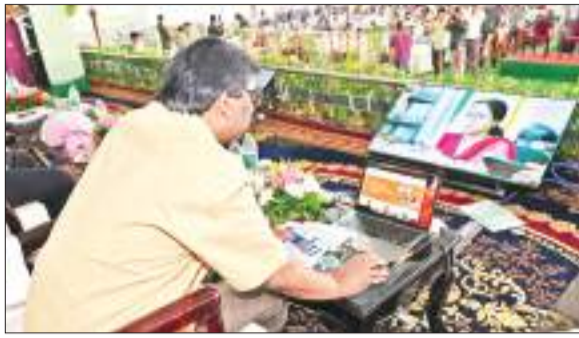
गुरुजी ऐप लांच करते मुख्यमंत्री हेमंत सोरेन।

उन्होंने कहा कि आज प्रतिस्पर्धा का जमाना है। ऐसे में सरकारी विद्यालयों के बच्चे पीछे नहीं रह जाएं, इसी को