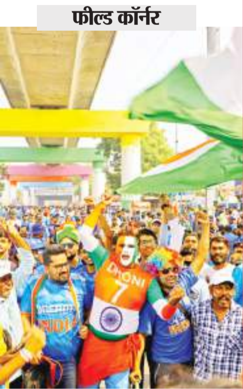
अहमदाबाद। भारत और पाकिस्तान के मैच के दौरान अपनी खुशी का इजहार करते खेल प्रेमी।