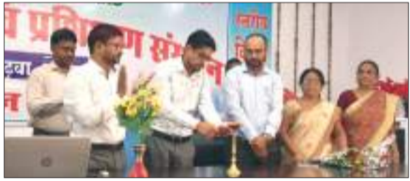
स्कूल स्तर के पदाधिकारी को प्रशिक्षण देते हुए डाइट के प्राचार्य।