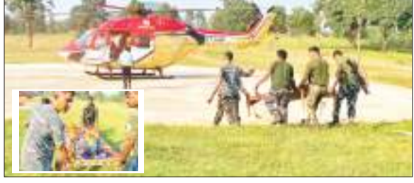
निकले। पुलिस जावनों ने जख्मी नक्सली को इलाज के लिए हेलिकॉप्टर से रांची भेजा। मालूम हो कि नक्सली राज्य में अपने आखिरी

झारखंड में नक्सलियों के अंतिम गढ़ कोल्हान में निर्णायक लड़ाई जारी है। झारखंड में नक्सलियों के खत्म को लेकर सुरक्षा बलों द्वारा चौतरफा संयुक्त अभियान झारखंड पुलिस, सीआरपीएफ, कोबरा, झारखंड जगुआर के साथ चलाया जा रहा है। इसी क्रम में शुक्रवार को पुलिस जावनों और नक्सलियों के बीच हुए मुठभेड़ में नक्सलियों ने अपने ही जख्मी साथी को छोड़कर भाग