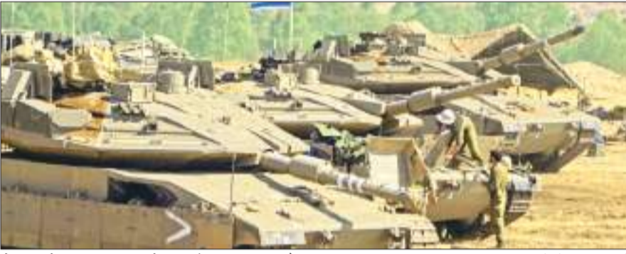
लेबनान में इजरायली सीमा के पास तैनात इजरायली टैंक।

इजराइल की सेना ने लगभग दस लाख फिलिस्तीनियों को उत्तरी गाजा को खाली करके सुदूर दक्षिण की ओर जाने को कहा है, जिसके बाद फिलिस्तीन के लोगों ने बड़ी संख्या में क्षेत्र से पलायन शुरू कर दिया है। इजराइल की चेतावनी के बीच, जमीनी कार्रवाई की आशंका बढ़ गई है। इजराइल की ओर से शुक्रवार को जारी हमलों के बीच लोग कार, ट्रक और खच्चरों पर परिजनों के अलावा जरूरत का कुछ सामान लाद कर दक्षिण में मुख्य सड़कों की तरफ निकल पड़े।