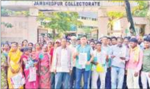
उपायुक्त कार्यालय के समक्ष विरोध जताते ग्रामीण।