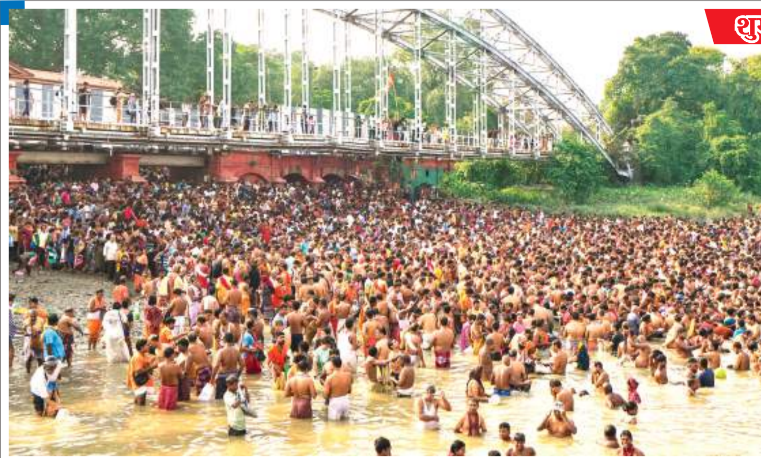
पितृ पक्ष के आखिरी दिन व महालाया के शुभ अवसर पर शनिवार को कोलकाता में गंगा नदी के किनारे अपने पूर्वजों के लिए पिंडदान अनुष्ठान करते श्रद्धालु।