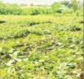
लागाकर अब सिंचाई करते हैं।

तो उन्होंने कुआं खुदवाया जिससे उनकी पानी की समस्या समाप्त हुई। आगे जब खेती का जब दायरा बढ़ा तो बोरिंग तथा कुसुम योजना का लाभ लेते हुए सोलर पैनल और सोलर पंप